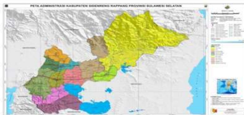
Gambar 1.1. Peta Kabupaten Sidrap

Berdasarkan hal tersebut maka dapat dikatakan bahwa jika dilihat dari struktur organisasinya, Badan Amil Zakat Nasional (BAZNAS) memiliki pimpinan dan beberapa staf atau pelaksana. Pimpinan terdiri dari 1 orang yang diwakili oleh 4 orang beserta dengan 4 orang staf lainnya yang mengelola bidang-bidang tertentu dalam Lembaga tersebut. Adapun para pimpinan dan staf tersebut memiliki tugas yang berbeda-beda tergantung dari posisinya di lembaga tersebut.