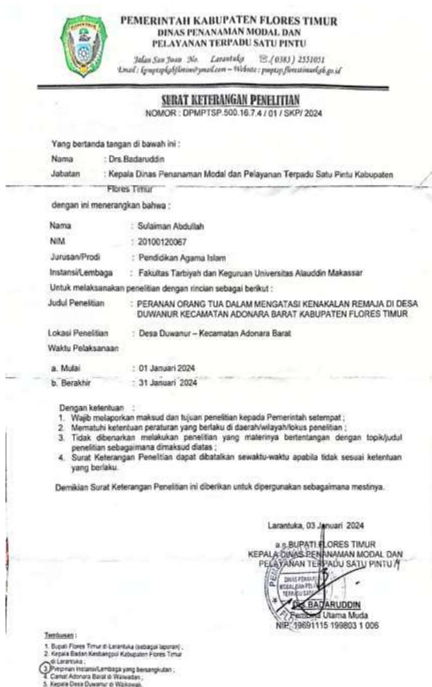
Gambar 16: Surat keterangan penelitian dari Dinas Penanaman Modal dan Pelayanan Terpadu Satu Pintu (DPMP/TSP) Kabupaten Flores Timur