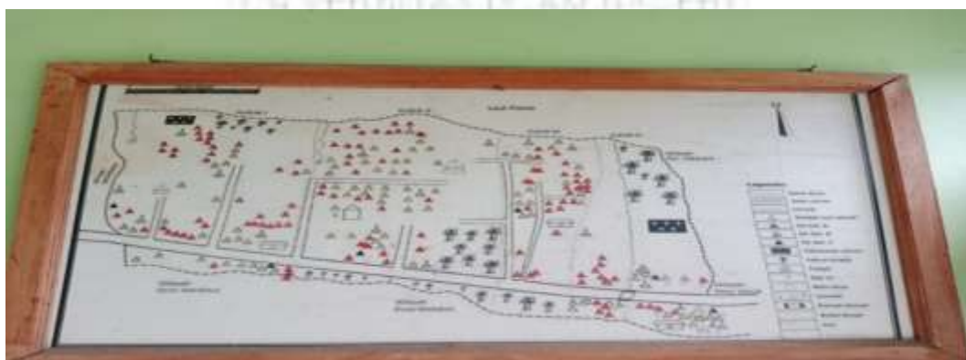
Gambar 4.1 Peta Desa Duwanur

Desa Duwanur merupakan salah satu desa dari 18 desa di Kecamatan Adonara Barat yang cukup dikenal dengan desa berpenduduk muslim terbanyak di Kecamatan Adonara Barat. Pola penyebaran perkampungan dalam desa menyusuri pantai yaitu tersebar dari manuk erin sampai crowerian. 1