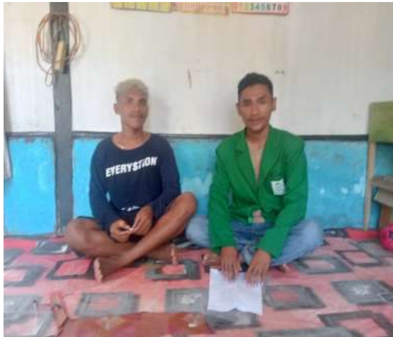
Gambar 12: Foto dengan Soadara fakurl Remaja Desa Duwanur setelah wawancara, di Desa Duwanur, 10 Januari 2024