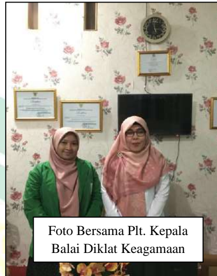
Foto Bersama Plt. Kepala Balai Diklat Keagamaan