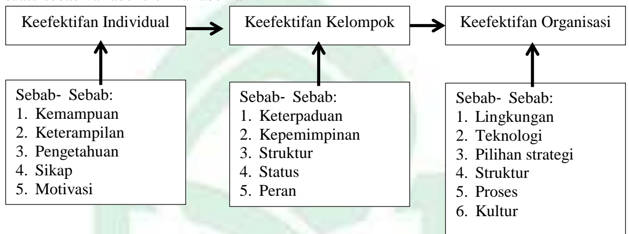
Gambar 1: Model Proses Sebab Keefektifan

Adapun menurut Gibson, Ivan Cevich, Donnelly (1996) yang dikutip dalam Wijaya dan Rifa'I, mengemukakan perspektif keefektifan dan mengidentifikasi sebab-sebab terjadinya keefektifan seperti yang ditunjukkan pada gambar di bawah ini dimana masing-masing tingkat efektivitas dapat dipandang sebagai suatu sebab variabel oleh variabel lain. 12