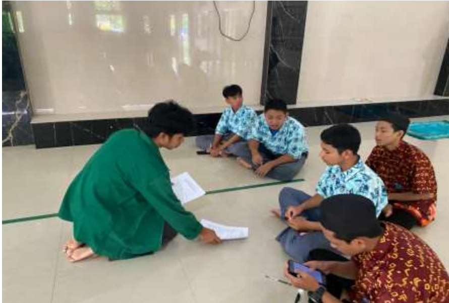
Membagikan Angket kepada Peserta Didik Laki-laki