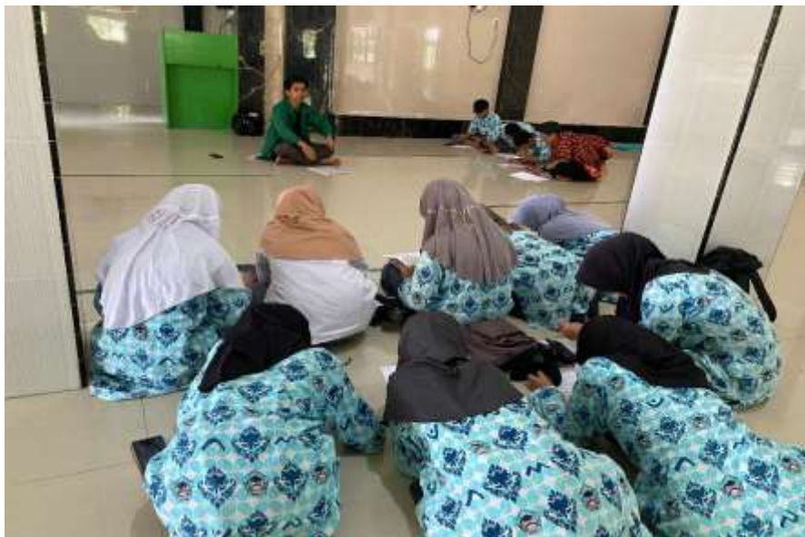
Peserta Didik mengisi Angket