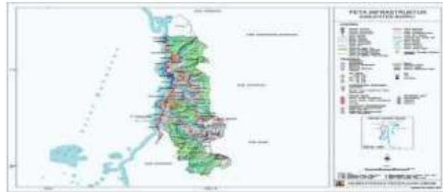
Gambar 4.1 Peta Kabupaten Barru