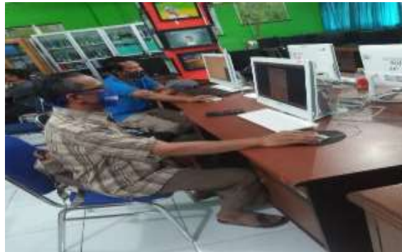
Gambar 4.1 Rekrutmen Peserta didik di pada masa Covid-19

Sebelum penerimaan peserta didik baru pastinya terdapat pembentukan kepanitiaan dimana yang dominan terlibat dalam kepanitiaan ini adalah guru Bimbingan Konseling dan beberapa guru lainnya. 3