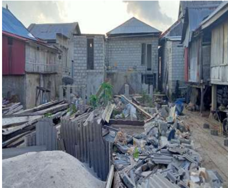
Foto 7. Situasi Rumah Warga Pasca Gempa di Desa Karumpa