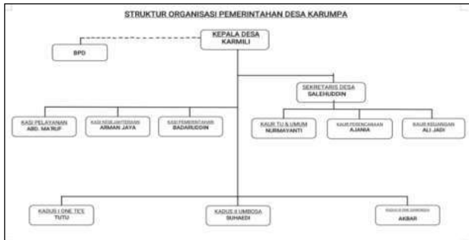
Gambar 4. 2 Struktur Pemerintahan Kantor Desa Karumpa