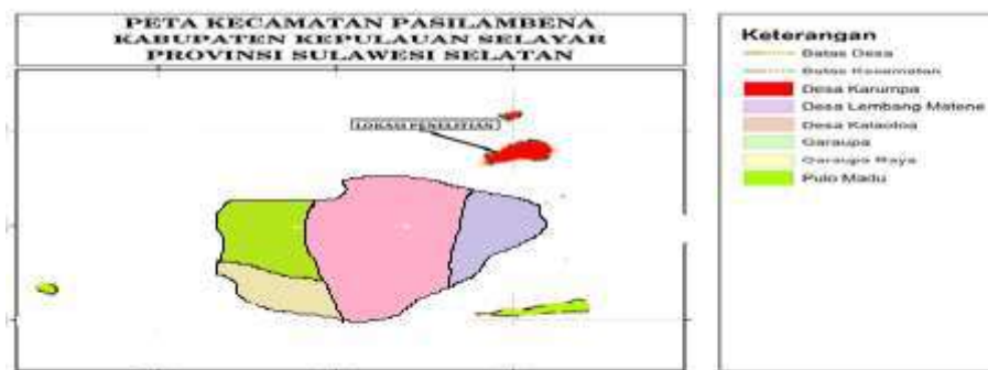
Gambar 4.1 Peta Kecamatan Pasilambena Kab. Kepulauan Selayar