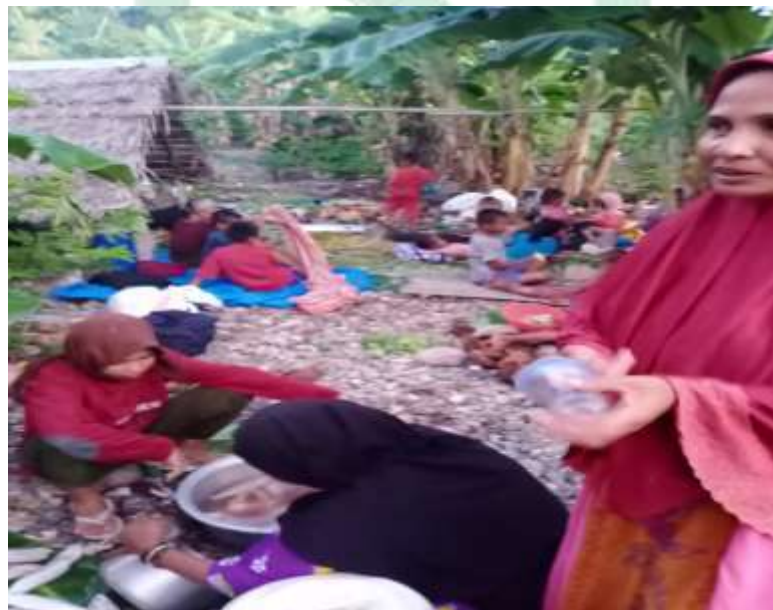
Foto 8. Keadaan dan Situasi Masyarakat di Tempat Pengungsian Pasca Gempa