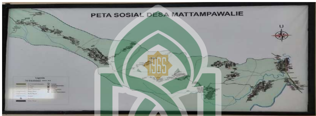
Sumber; Peta Desa Mattampawalie Tahun 2021.