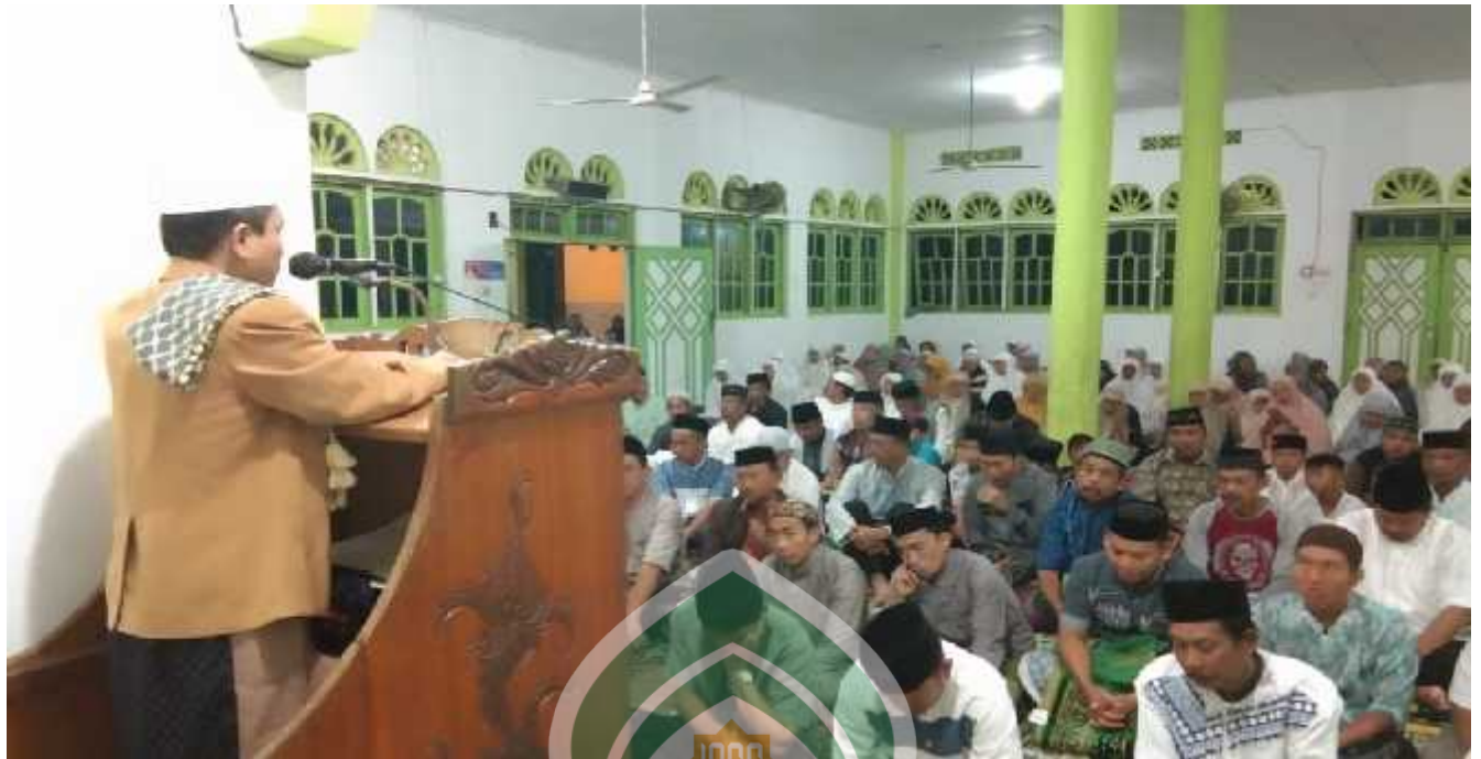
Proses membawa ceramah agama pada kegiatan subuh mengaji di masjid nuruttaufiq desa tettikenrarae kec.marioriwawo kab.soppeng