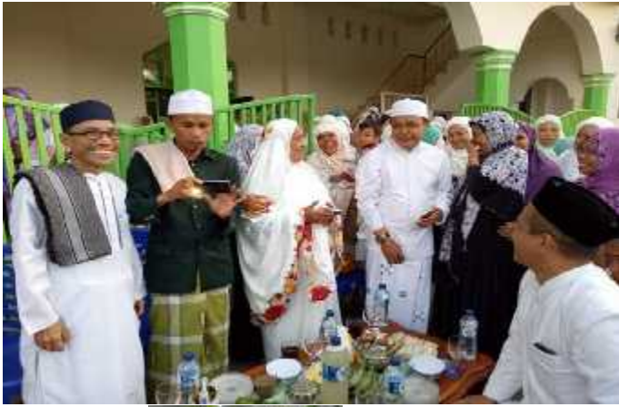
Makan bersama sekaligus sosialisasi bersama masyarakat subuh mengaji di kab.soppeng