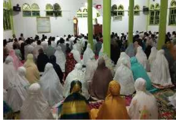
Proses kegiatan subuh mengaji di masjid nurul hidayah desa laringgi kec. Marioriawa kab.sopeng