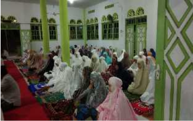
Proses kegiatan dzikir bersama pada kegiatan subuh mengaji di masjid syuhada 45 di desa sering kec.donri-donri