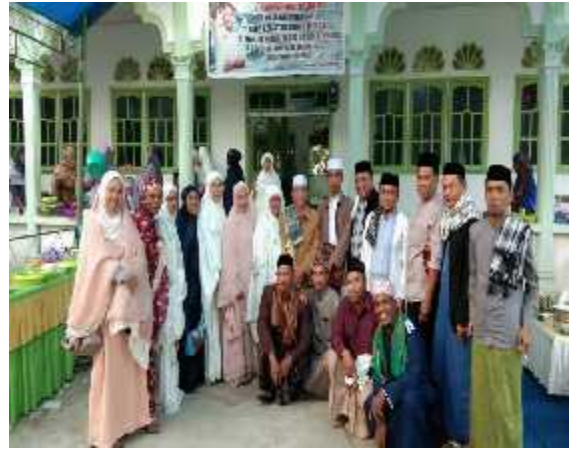
Foto bersama masyarakat setelah pengajian di masjid nurul yaqin desa jampu kec.liliriaja kab.soppeng