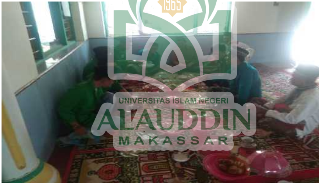
Makan bersama sekaligus sosialisasi bersama masyarakat subuh mengaji di kab.soppeng