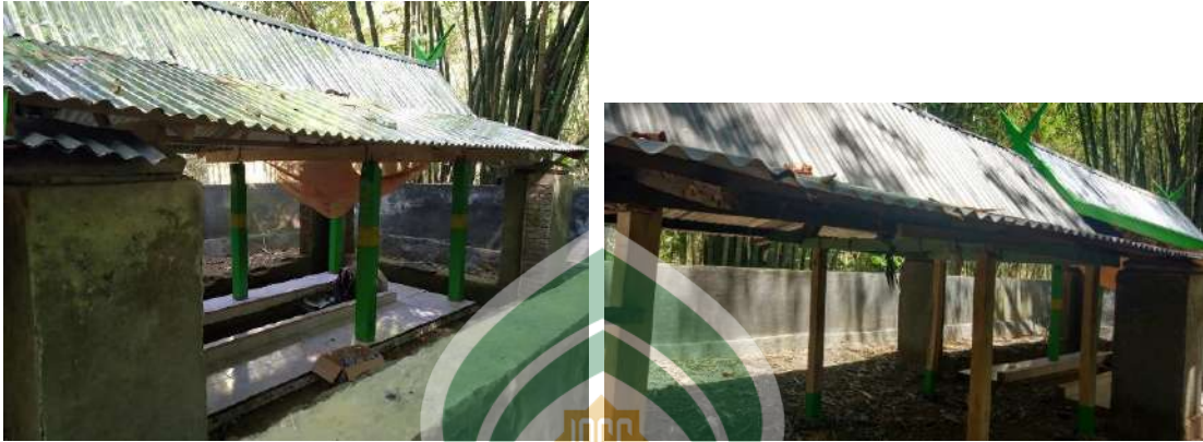
MAKAM TAMPUNG LAMPE