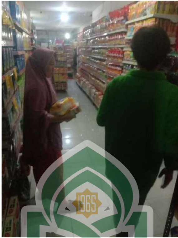
Dokumentasi ibu rumah tangga buruh migran