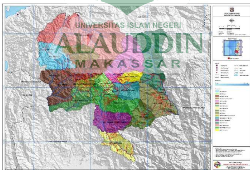
Gambar 4.1 Peta Kabupaten Mamasa