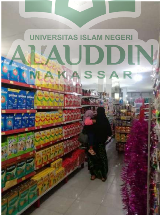
Dokumentasi ibu rumah tangga buruh migran