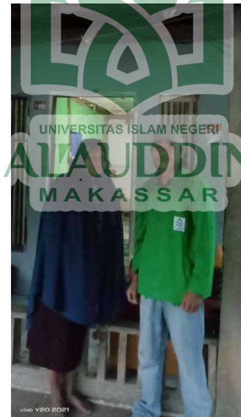
Dokumentasi bersama Ibu Sanni