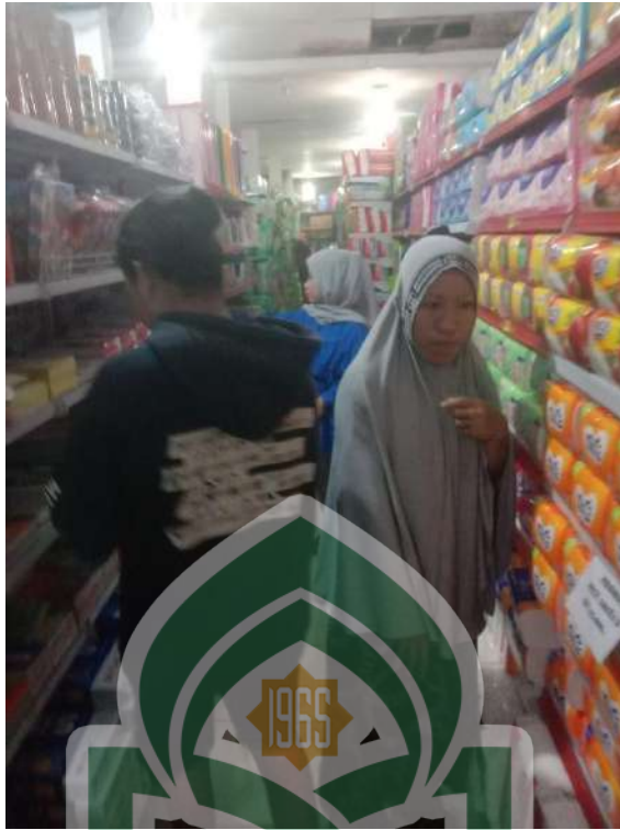
Dokumentasi ibu rumah tangga buruh migran