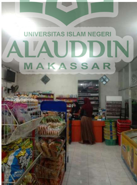
Dokumentasi ibu rumah tangga buruh migran