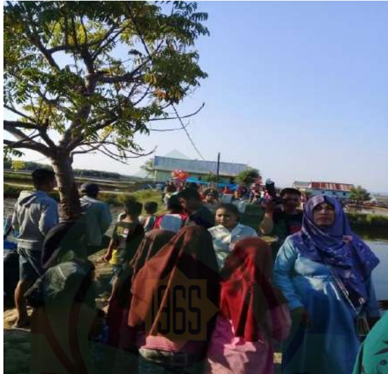
Gambar 1: Ketika pengantin perempuan tiba