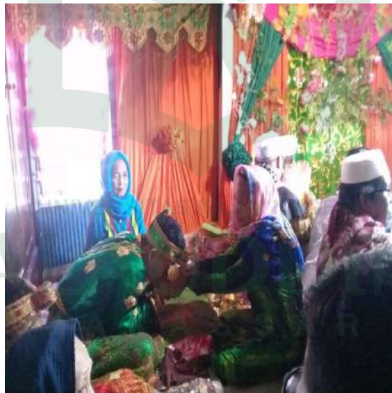
GAMBAR 2 :Ketika pengantin laki-laki meminta do'a restu kepada keluarga