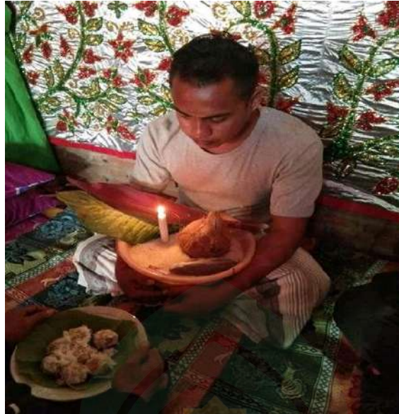
GAMBAR 1 :Ketika pengantin melakukan pencukuran bulu kening