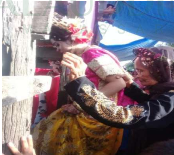
GAMBAR 5 : Ketika nenek dari pengantin laki laki menjemput pengantin perempuan