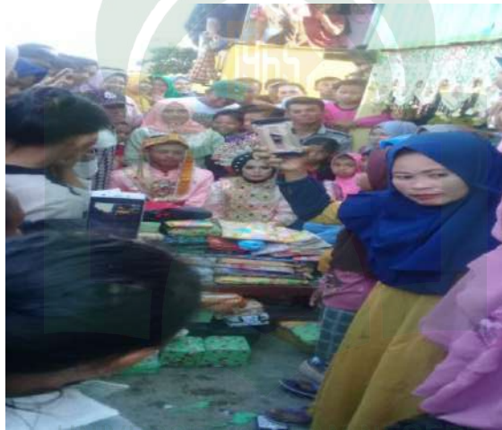
GAMBAR 4 : Ketika menunggu tibanya orang yang akan appanaung