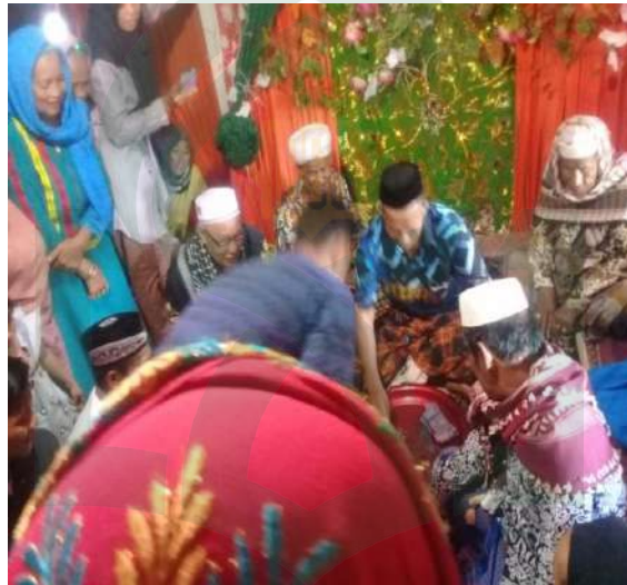
GAMBAR 4 : Ketika tradisi Appanaung Do'e di laksanakan