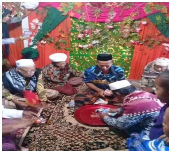
GAMBAR 5 : Ketika tradisi Appanaung Do'e Selesai dan perhitungan uang di laksanakan