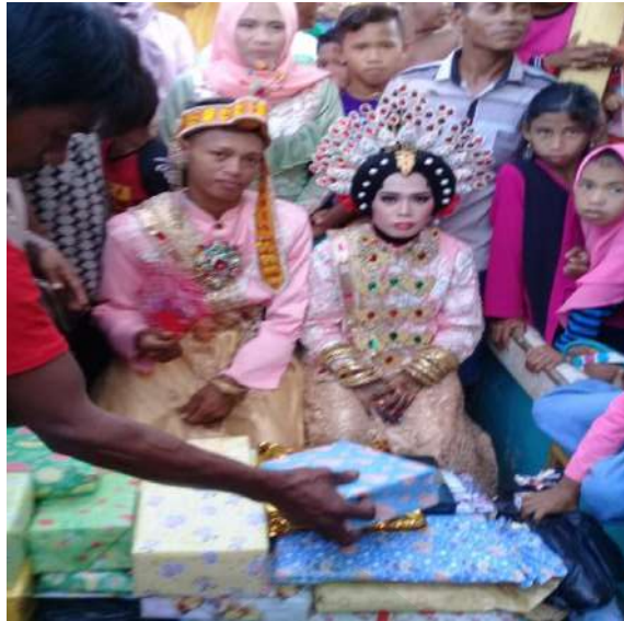
GAMBAR 3 : Ketika tradisi Appanaung dimulai