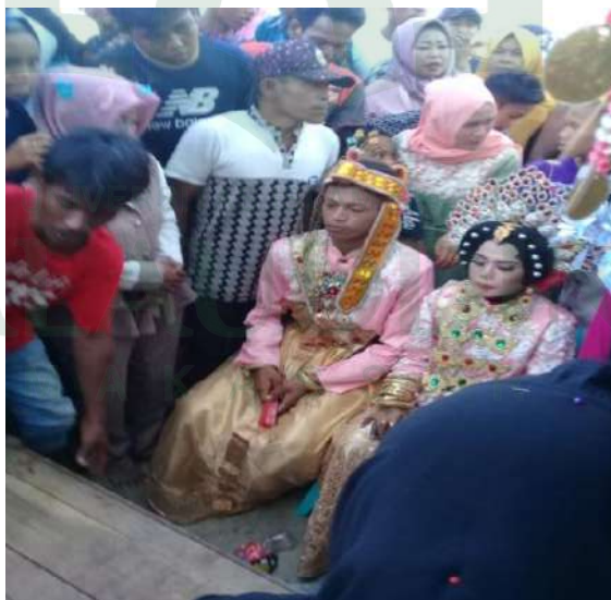
Gambar 2 : Ketika persiapan mensejajarkan pengantin