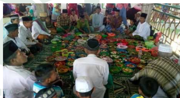
Gambar doa bersama