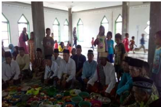
Gambar pada saat dimulainya tradisi zikir jepe sura dimasjid