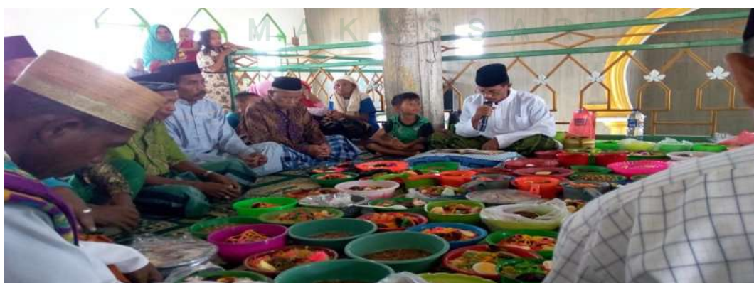
Gambar pada saat zikir bersama