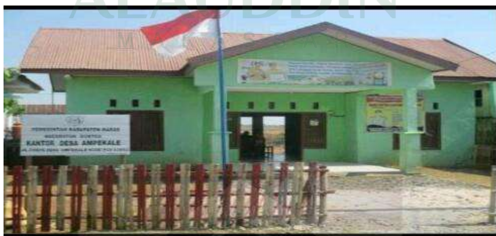
Gambar Kantor Desa Ampekale