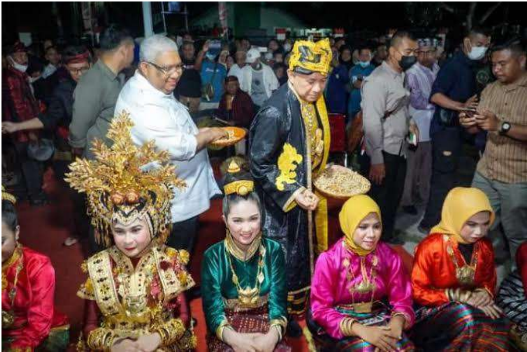
Gambar 14: Tradisi Kamomoose Kelurahan Gu Timur Kecamatan Lakudo Kabupaten Buton Tengah