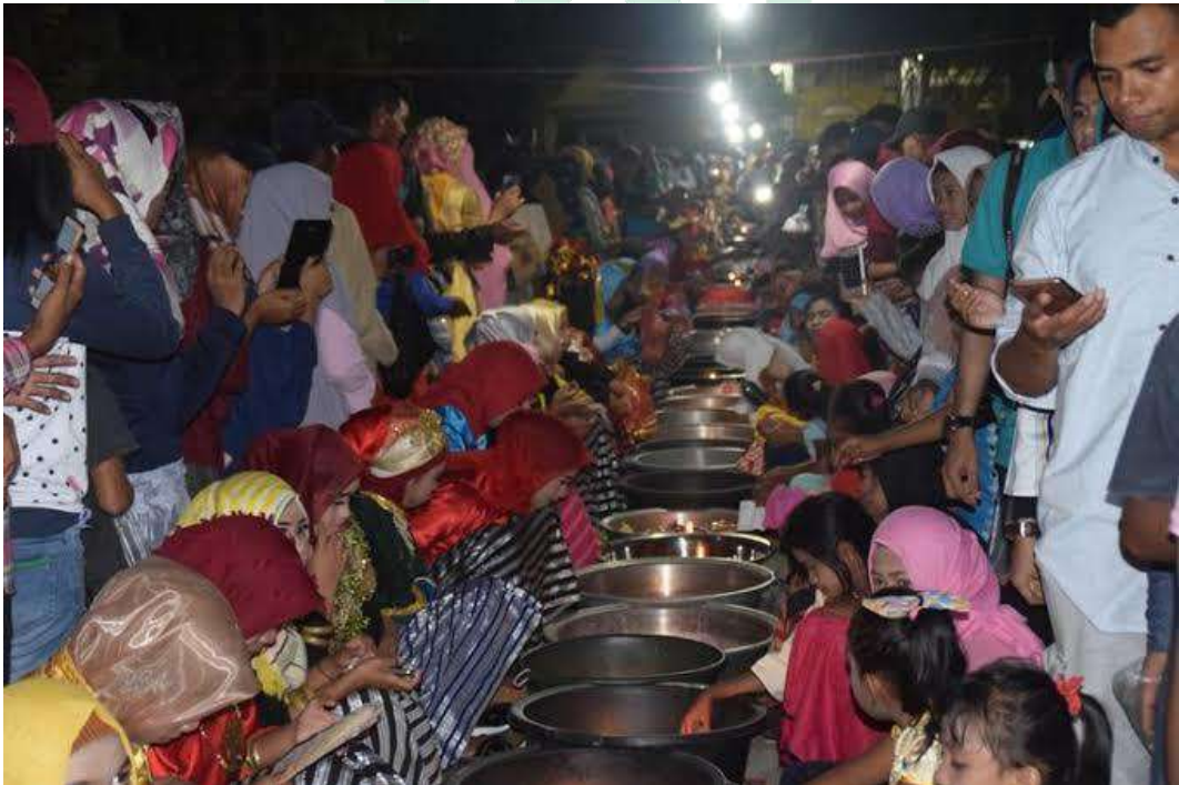
Gambar 15: Tradisi Kamomoose Kelurahan Gu Timur Kecamatan Lakudo Kabupaten Buton Tengah