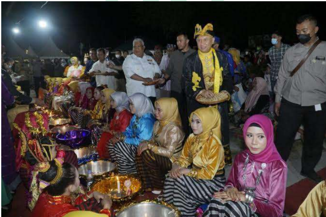
Gambar 13: Tradisi Kamomoose Kelurahan Gu Timur Kecamatan Lakudo Kabupaten Buton Tengah