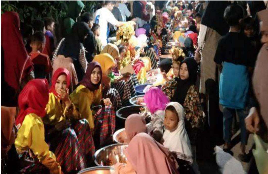
Gambar 16: Tradisi Kamomoose Kelurahan Gu Timur Kecamatan Lakudo Kabupaten Buton Tengah