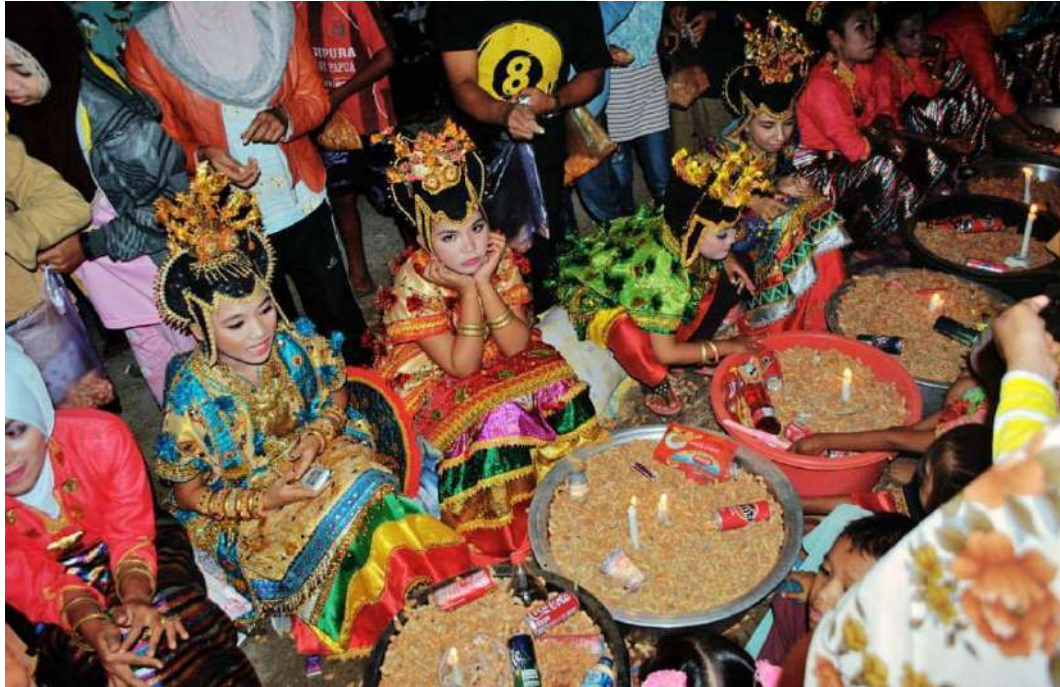
Gambar 17: Tradisi Kamomoose Kelurahan Gu Timur Kecamatan Lakudo Kabupaten Buton Tengah