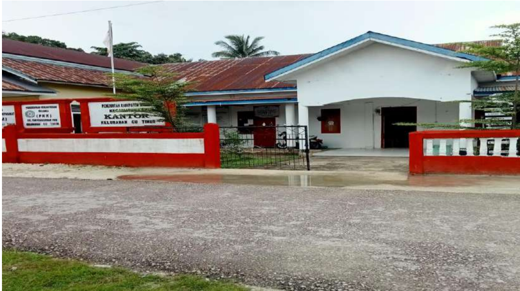
Gambar 2: Kantor Kelurahan Gu Timur