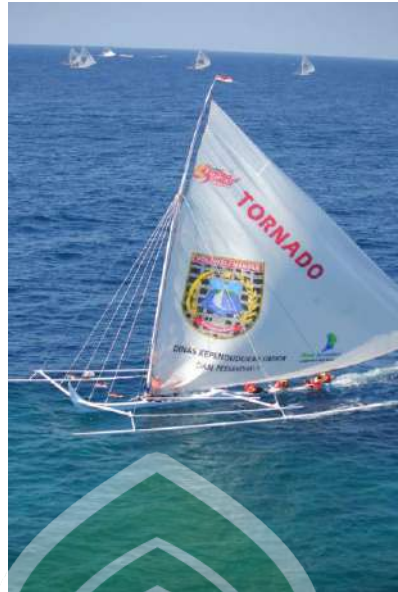
Keterangan : Perahu Sandeq

Sandeq memiliki sifat terjauh, terkeras dan tercepat. Tanpa dijelaskan panjang lebar sandeq race merupakan kebanggaan masyarakat Mandar sebagai pewaris sah tradisi persandeq-an, tanpa mengedepankan primordialisme yang berlebihan. Para posasiq (nelayan) Mandar menjadikannya beberapa tipe yang diklasifikasikan sesuai dengan penggunaannya. Walaupun demikian, tipe-tipe berikut ini tidak terbatas pada kegiatan yang dilakukan, dengan kata lain perahu sandeq dapat melakukan semua aktivitas yang dimaksud, khususnya kegiatan motangnga dan marroppong . 43