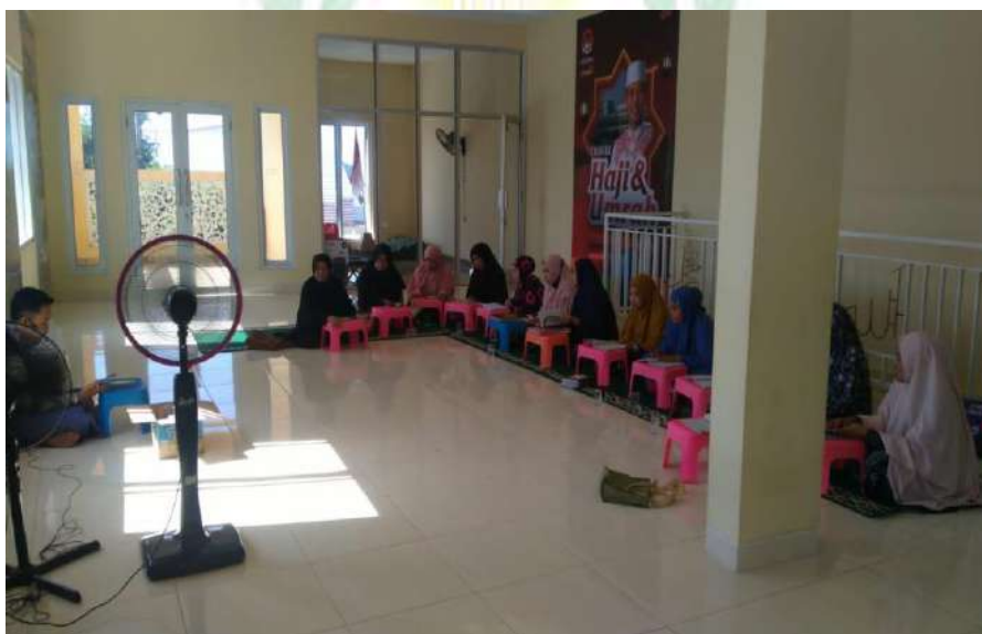
Gambar 2.1 Kegiatan majelis ta'lim