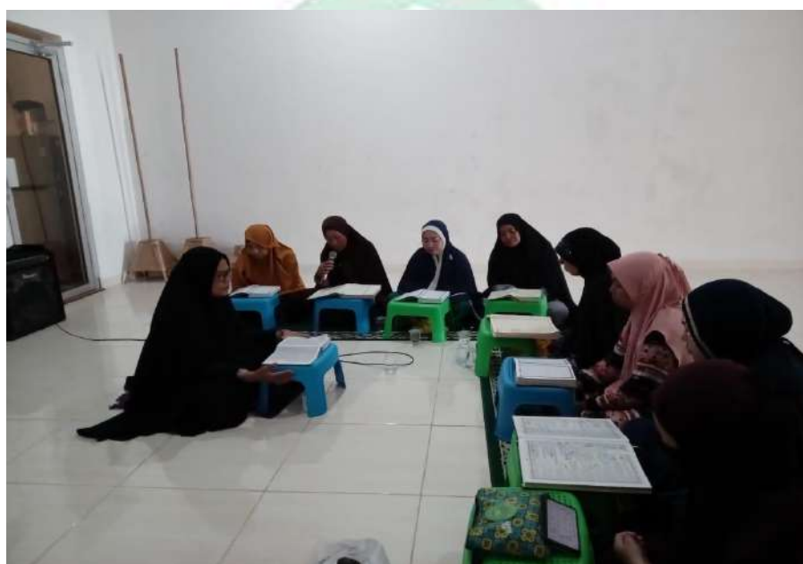
Gambar 3.1 Kegiatan pembacaan ayat suci Al-Qur'an

Dari pernyataan wawancara di atas dapat disimpulkan bahwa sebelum memulai Program Majelis Ta'lim terlebih dahulu diawali dengan Mengaji Al-Qur'an, setelah itu dilanjutkan dengan ceramah dan diskusi yang di bawakan oleh ustadz/ustadzah yang tentunya lebih mengarah ke pembahasan tentang tauhid Uluhiyah. Sebab masih adanya masyarakat yang masih mempersekutukan Allah dan melakukan perbuatan syirik. Dapat dilihat pada gambar di bawah :