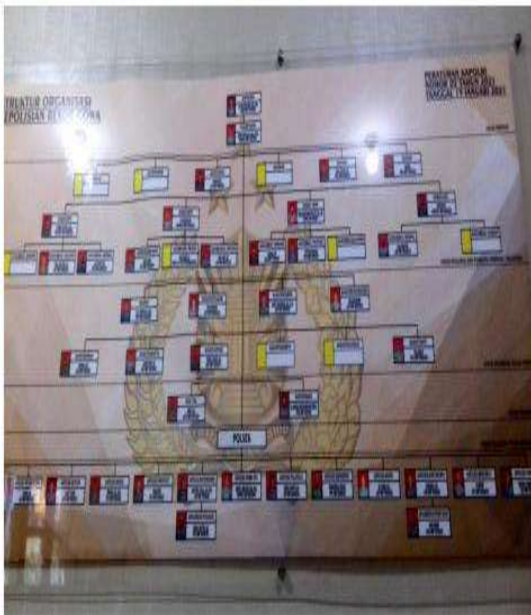
Gambar 4.1 Struktur Organisasi Polres Gowa.