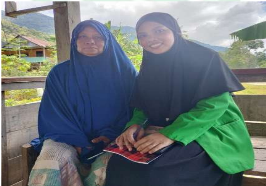
Wawancara bersama Ibu Rasna selaku Ibu rumah tangga dan petani di Desa Tapong