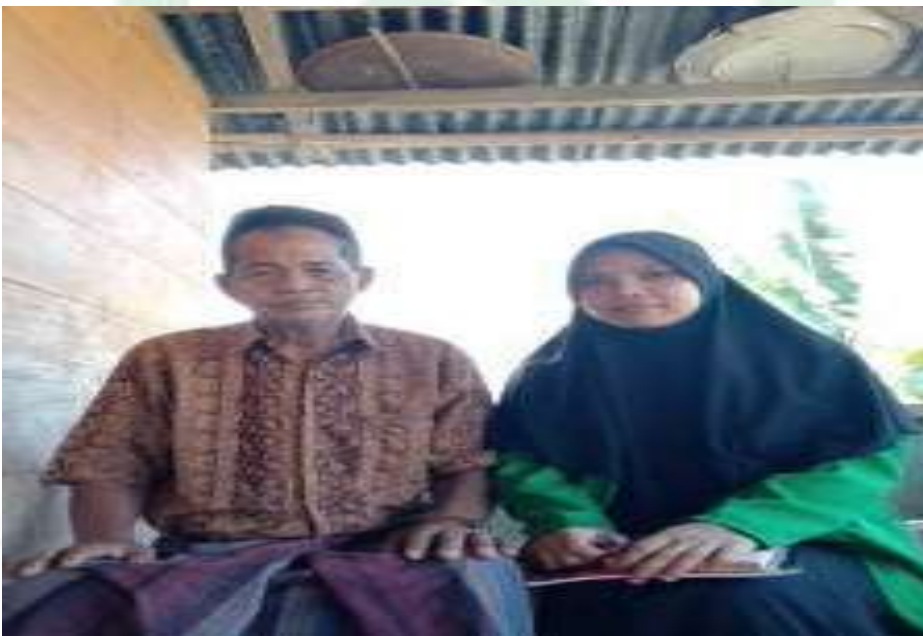
Wawancara bersama Bapak Cunggu selaku Imam Masjid dan petani di Desa Tapong