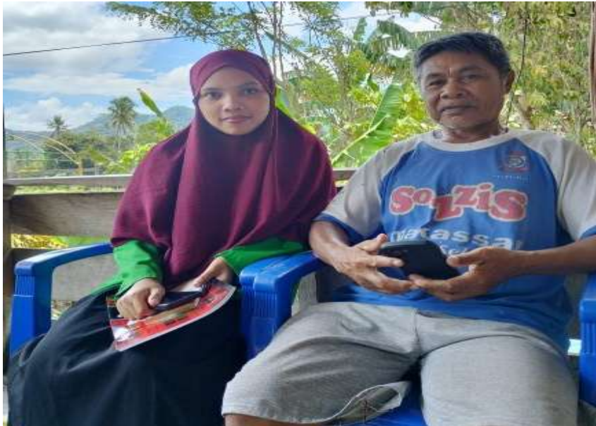
Wawancara bersama Bapak Ahlal selaku petani di Desa Tapong