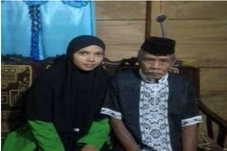
Wawancara bersama Bapak Hatta selaku petani di Desa Tapong