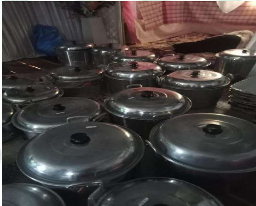
Gambar 12: Panci, barang A'matoang dan Pa'balanggang