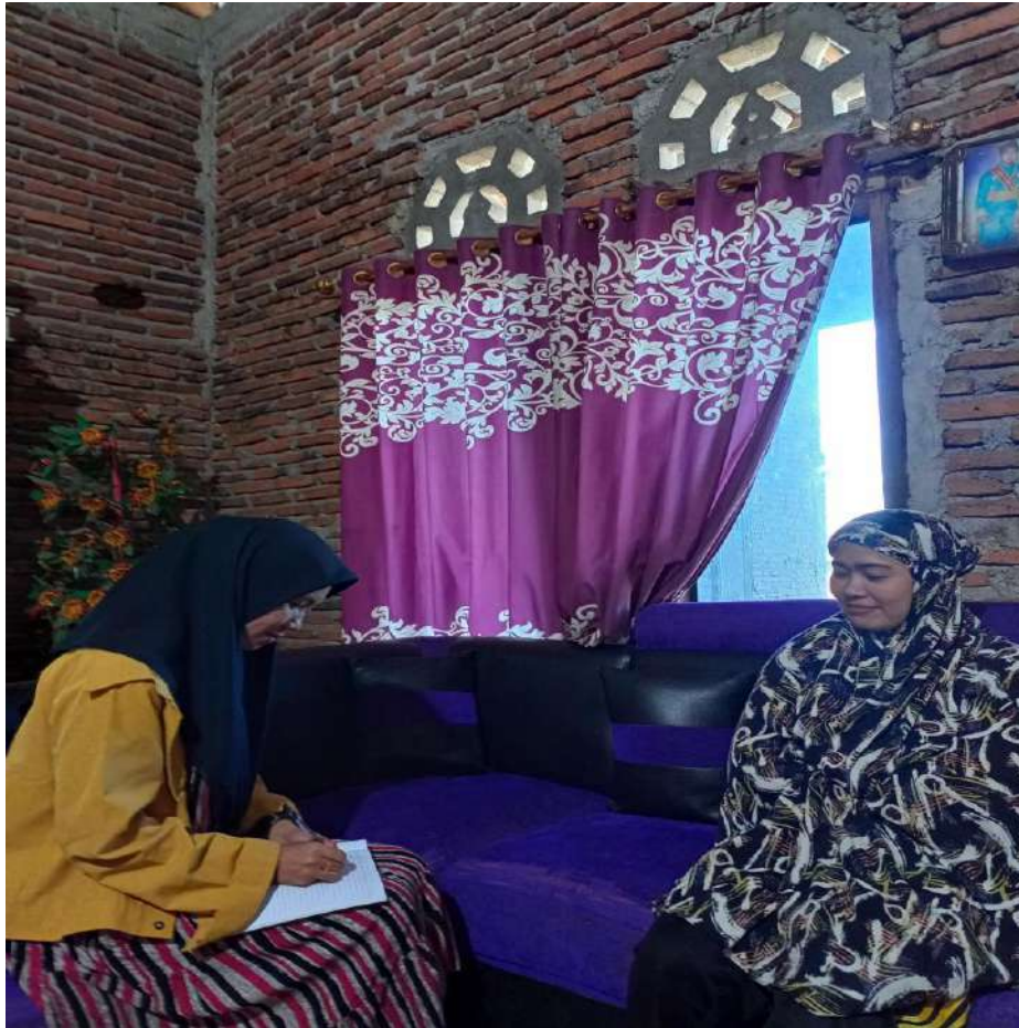
Gambar 6: Wawancara bersama Ibu Dg Baji' selaku masyarakat Desa Lebangmanai Kecamatan Rumbia Kabupaten Jeneponto. 17 September 2023.

UNIVERSITAS SYARIAH ALAUDDIN RIAU WAKILAH