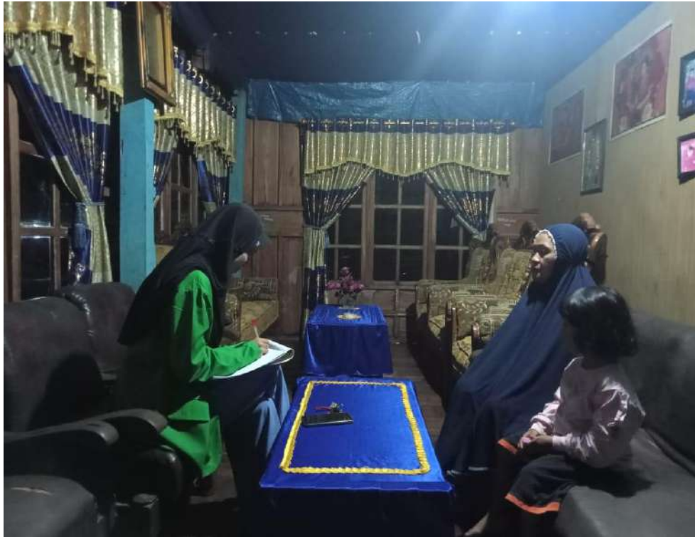
Gambar 8: Wawancara bersama Ibu Dg ngai selaku masyarakat Desa Lebangmanai Kecamatan Rumbia Kabupaten Jenepono. 19 September 2023

UNIVERSITAS MUHAMMADIYAH ALAUDDIN KEMBARA