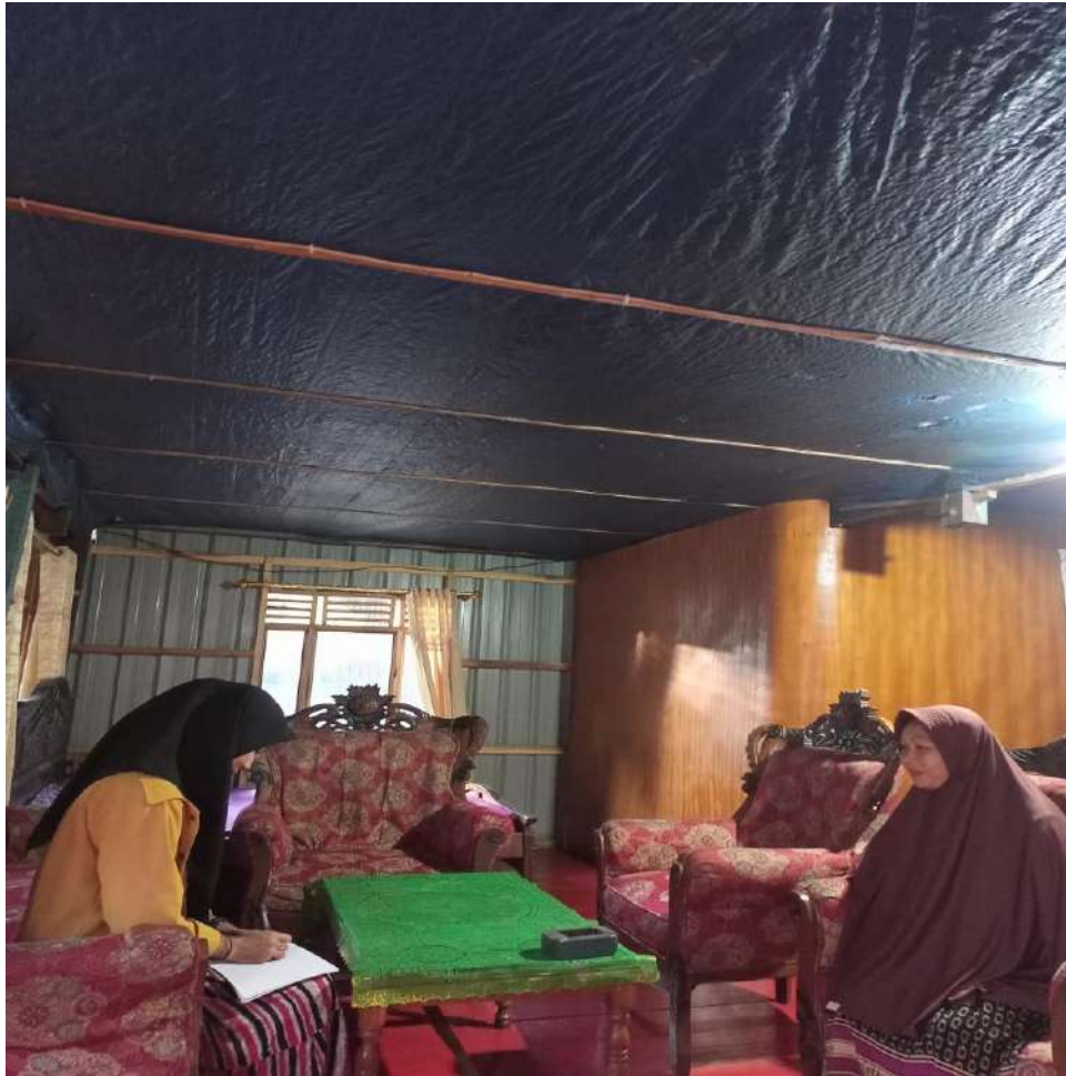
Gambar 3: Wawancara bersama Ibu Dg Kanang selaku masyarakat Desa Lebangmanai Kecamatan Rumbia Kabupaten Jenepono. 13 September 2023

UNIVERSITAS MUHAMMADIYAH ALAUDDIN KOTA MAKASSAR