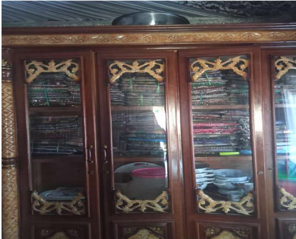
Gambar 11: Lemari, Barang A'matoang dan Pa'balanggang