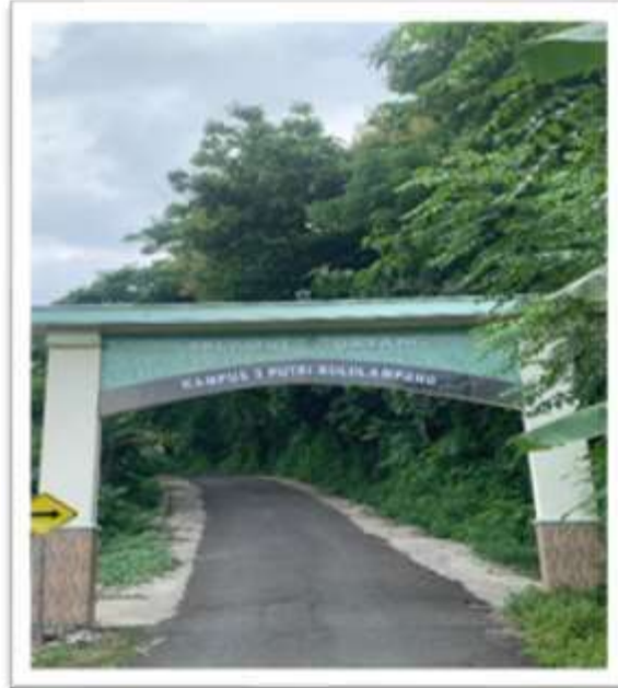
Gambar 1: Gerbang Utama Pondok Pesantren DDI Mangkoso Kampus 3 Putri Bulu Lampung kabupaten Barru