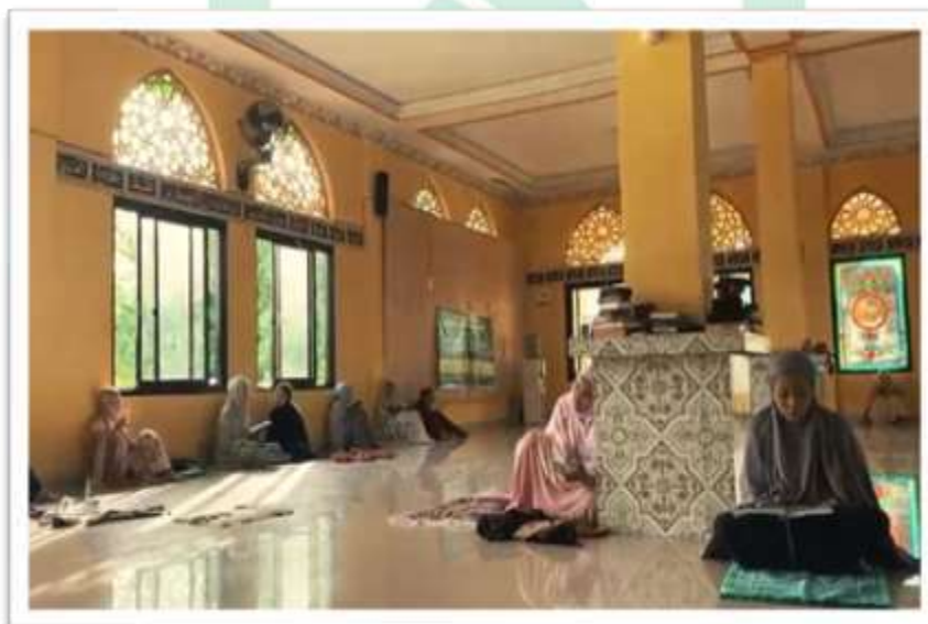
Gambar 6: Kegiatan menghafal Al-Qur'an (Santri yang Mengikuti Program Tahfidz) di Kampus 3 Putri Bulu Lampung.