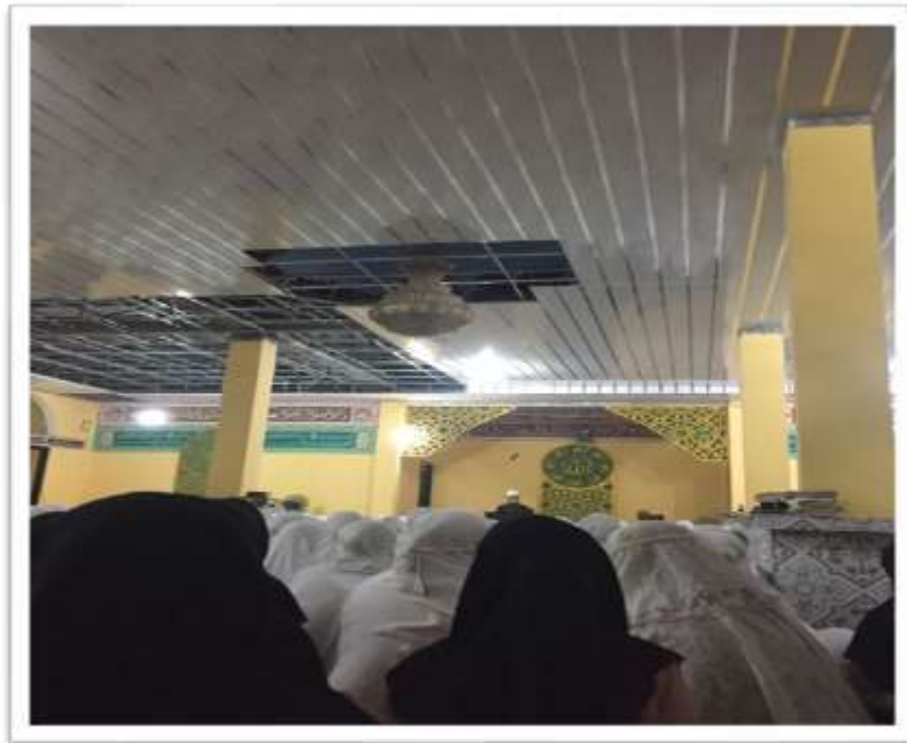
Gambar 5: Kegiatan Pengajian Ba'da Magrib di Mushollah Nuruh Huda 2 Pondok Pesantren DDI Mangkoso Kampus III Putri bulu Lampung Kabupaten Barru