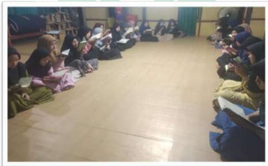
Gambar 2: Kegiatan Yasinan Bersama di Asrama Tahfidz 3 Bulu Kampus 3 Putri Bulu Lampung Lampung.