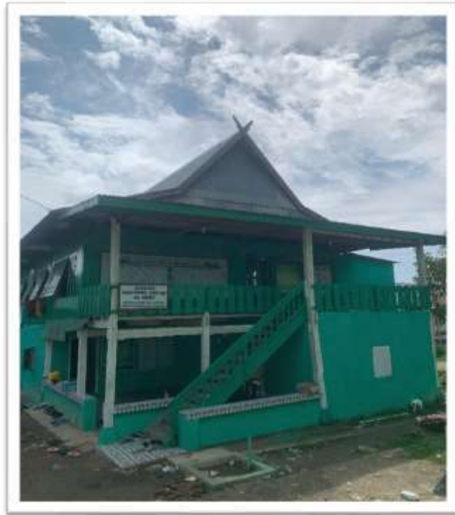
Gambar 3: Asrama Tahfidz 4 di Kampus 3 Putri Bulu lampang