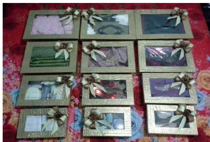
Gambar 2. Isi dari seserahan ialah berupa Al-Quran, seperangkat alat sholat, alat mandi, pakaian dalam, make up, baju, dan sendal