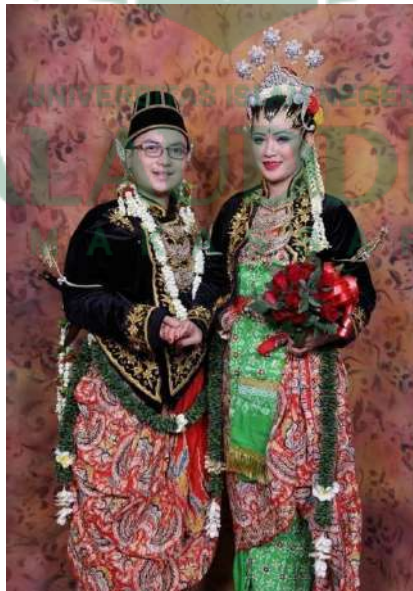
Gambar 6. Pakaian pernikahan Budaya Jawa

Setelah pengantin laki-laki selesai menginjakatelur maka pengantin perempuan akan membersihkan kaki laki-laki dalam posisi berlutut sebagai rasa hormat