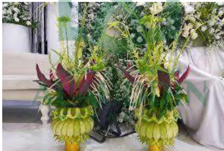
Gambar 4. Kembar Mayang Sepsang hiasan dekoratif yang dibentuk dari rangkaian akar, batang, daun, bunga, dan buah setinggi satu badan orang dewasa.