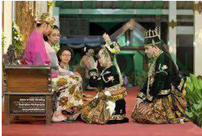
Gambar 8. Sungkeman

Adalah proses pengantin akan bersimpuh di depan orang tua sebagai penghormatan atas jasa orang tua.