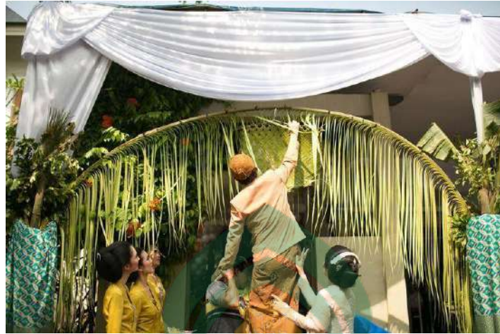
Gambar 3. Proses pemasagandekorasi tenda yang dinamakan tarub