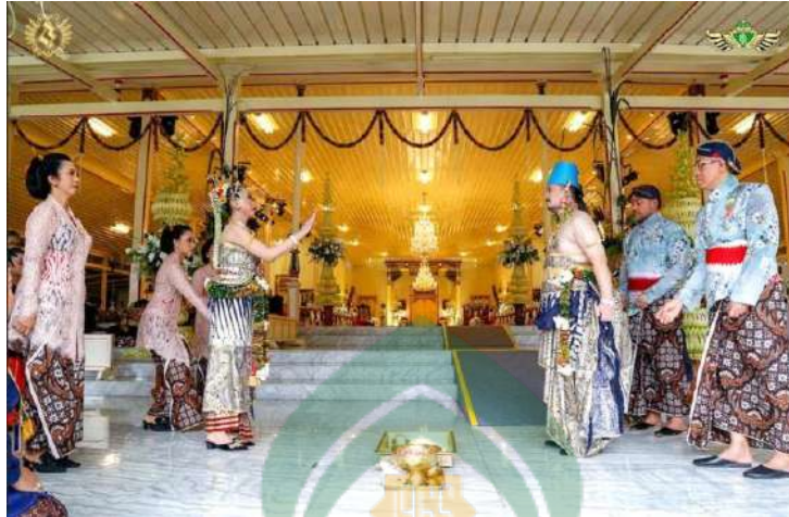
Gambar 7. Proses balangan Gantal dimana pesangan pengantin saling melepar gantal (daun sirih yang di ikat benang putih)