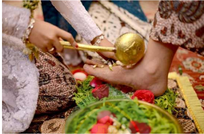
Gambar 5. Proses ngindak endhog

Setelah pengantin laki-laki selesai menginjakatelur maka pengantin perempuan akan membersihkan kaki laki-laki dalam posisi berlutut sebagai rasa hormat