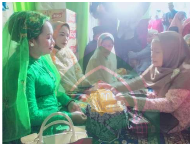
Gambar 1. Penyerahan sisa duek seserahan

Penyerahan sisa uang belanja dilakukan ketika mempelai pengantin laki-laki datang ke rumah pengantin perempuan ketika ingin melakukan akad