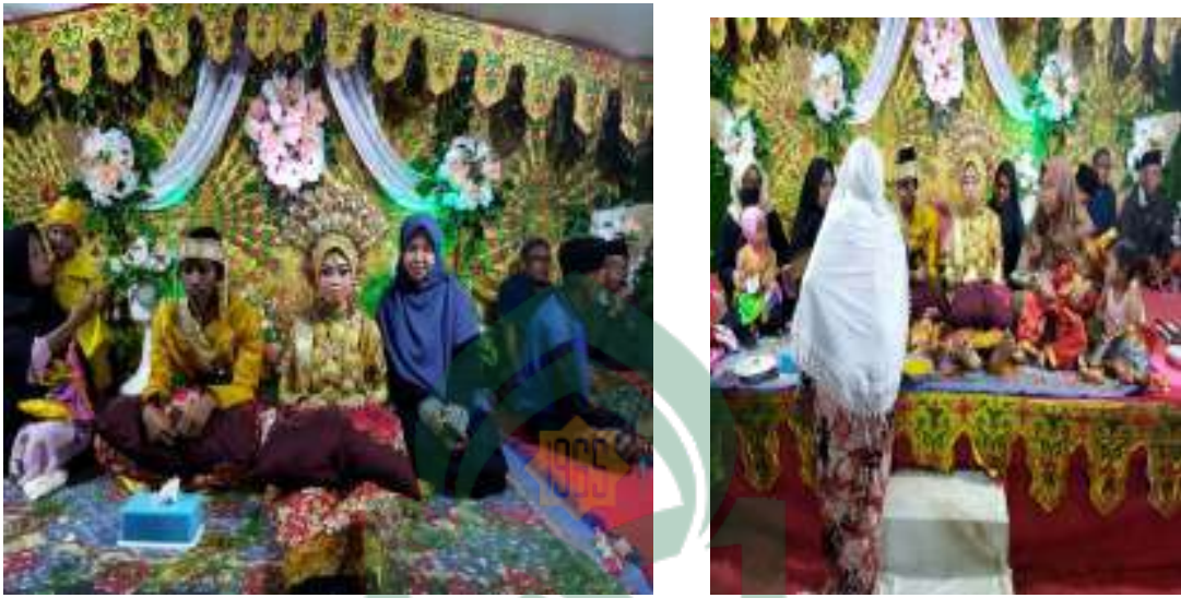
Gambar 6 : Peneliti foto bersama selesai acara Kapanca atau pacar