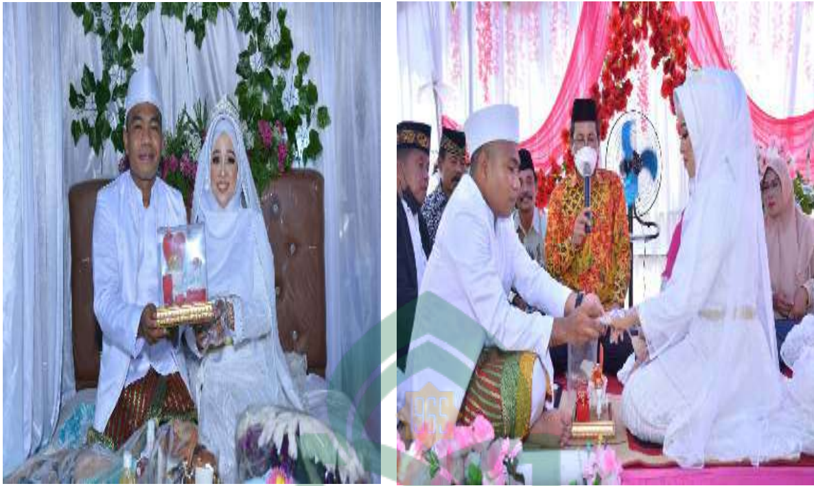
Gambar 7 Letak Budaya Islam yaitu pada saat Ijab Kabul dan letak budaya lokalnya adalah pakaian pengantin perempuan yang menggunakan baju tradisional