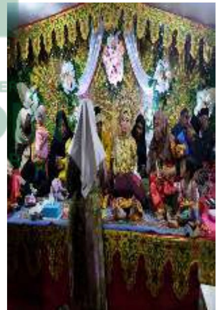
Gambar 3 dan 4 : Letak Budaya Lokal pada gambar di atas adalah pada saat para undangan meletakkan daun pacar di tangan, percikan air dan dilempari beras kuning pada pengantin. Acara Malam Kapanca atau Pacar