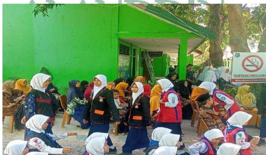
Beberapa Guru yang Turut Hadir dalam Kegiatan Tersebut