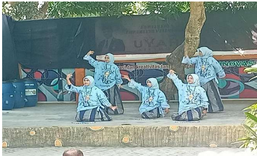
Salah Satu Rangkaian Kegiatan (Menari)