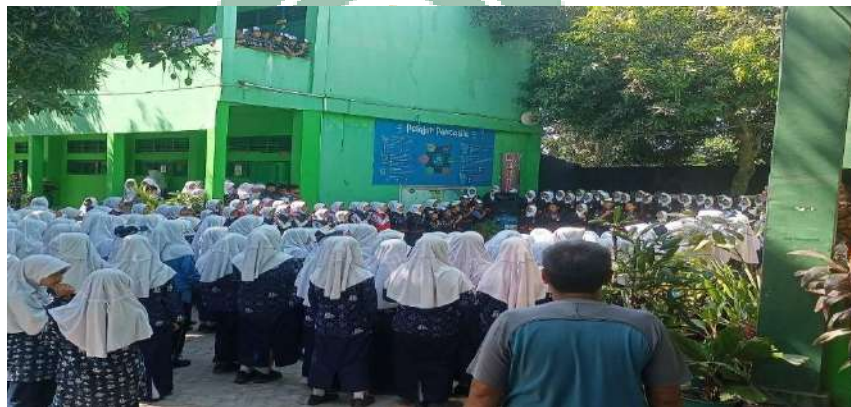
Suasana Selama Kegiatan Berlangsung