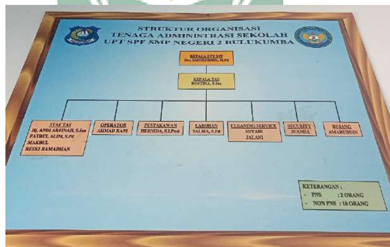
Struktur Organisasi Administrasi Sekolah SMP Negeri 2 Bulukumba