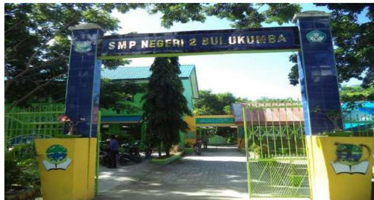
Pintu Gerbang Masuk SMP Negeri 2 Bulukumba