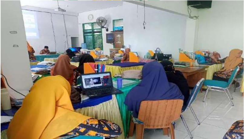
Rapat Kepala Sekolah dan semua Guru