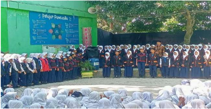
Kegiatan Sekolah yang Diadakan Setiap Seminggu Sekali SMP Negeri 2 Bulukumba