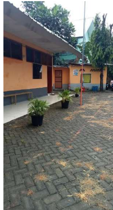
Gambar 4: Tampak Dalam dan Tampak Depan Ruang Kelas SMP Makassar Mulya Kota Makassar