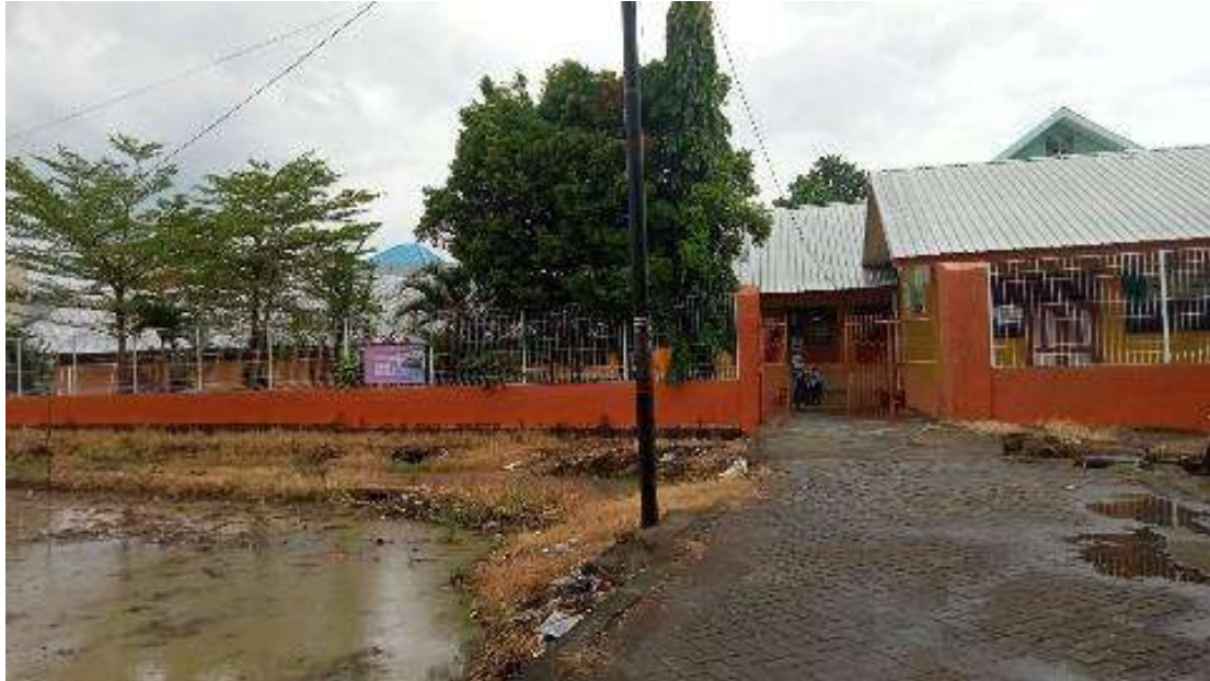
Gambar 3: Tampak Depan SMP Makassar Mulya Kota Makassar