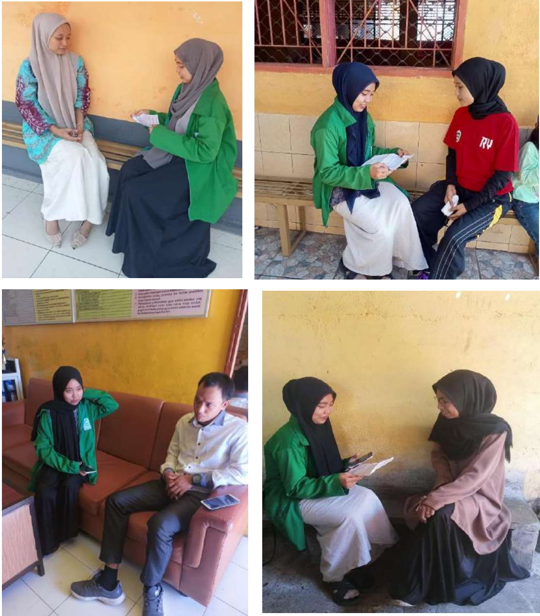
Gambar 8 : Wawancara Dengan Beberapa Guru di SMP Makassar Mulya Kota Makassar