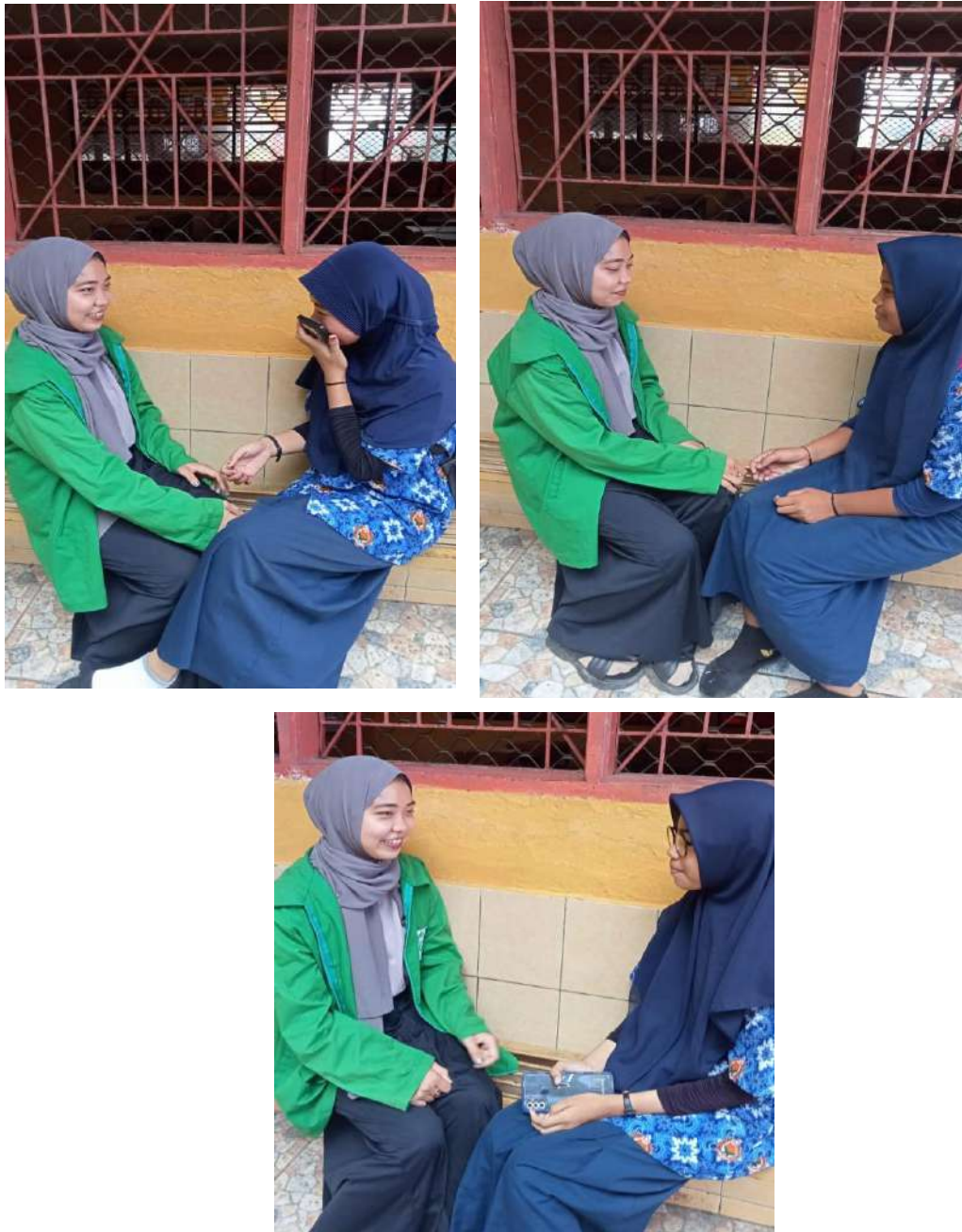
Gambar 9 : Wawancara Dengan Beberapa Peserta Didik di SMP Makassar Mulya Kota Makassar