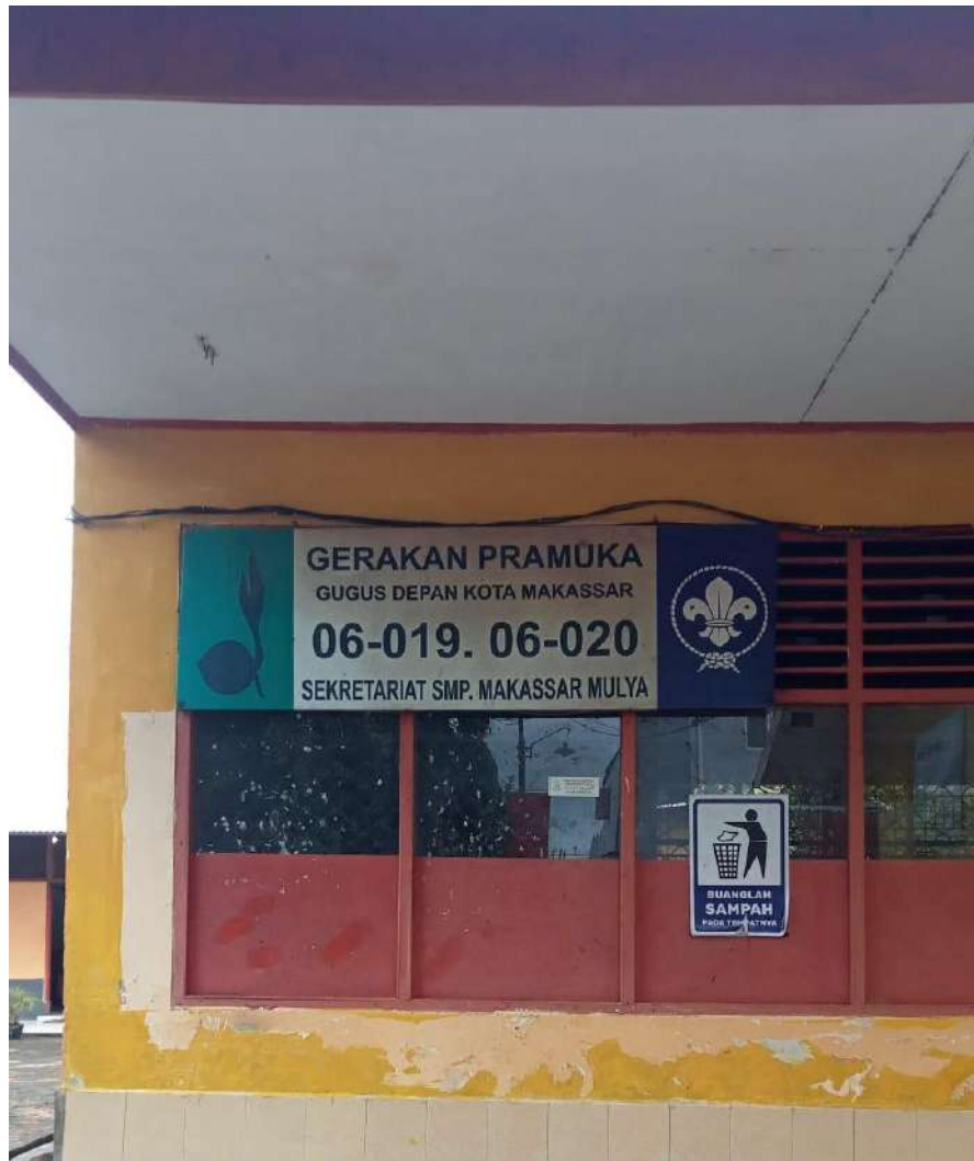
Gambar 7: Kesekretariatan Gerakan Pramuka SMP Makassar Mulya Kota Makassar