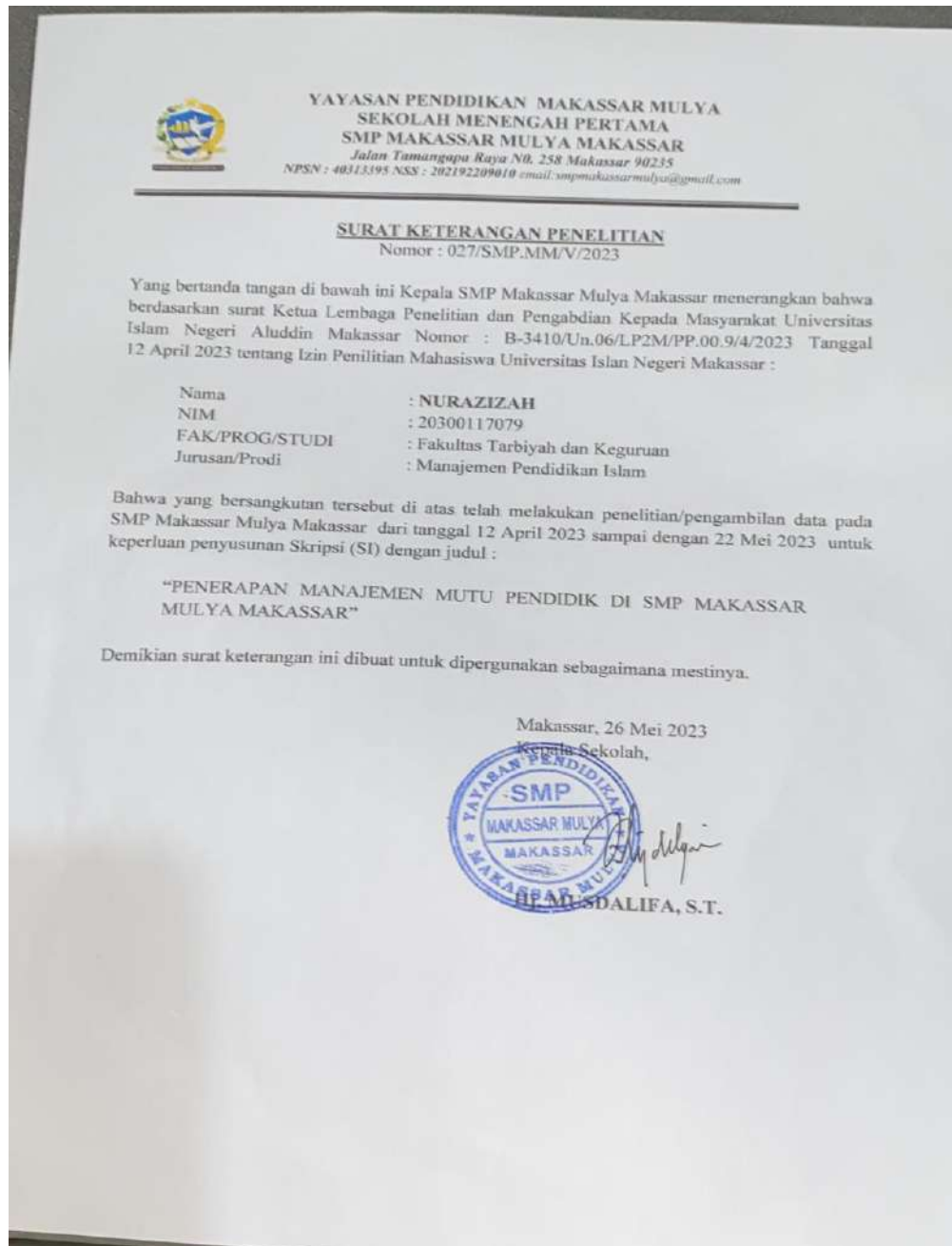
Gambar 1: Surat Penyataan Sudah Penelitian di SMP Mulya Makassar Kota Makassar