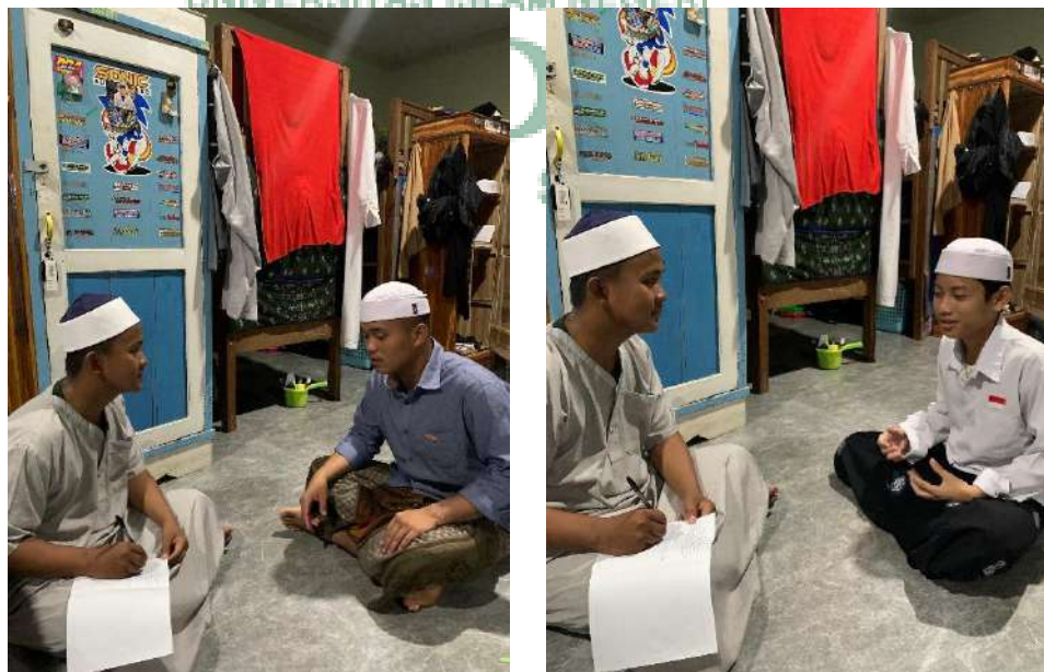
Wawancara bersama santri Asrama Huffadz 1