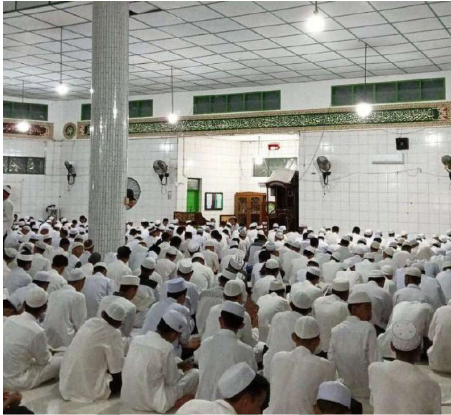
Dokumentasi kegiatan santri