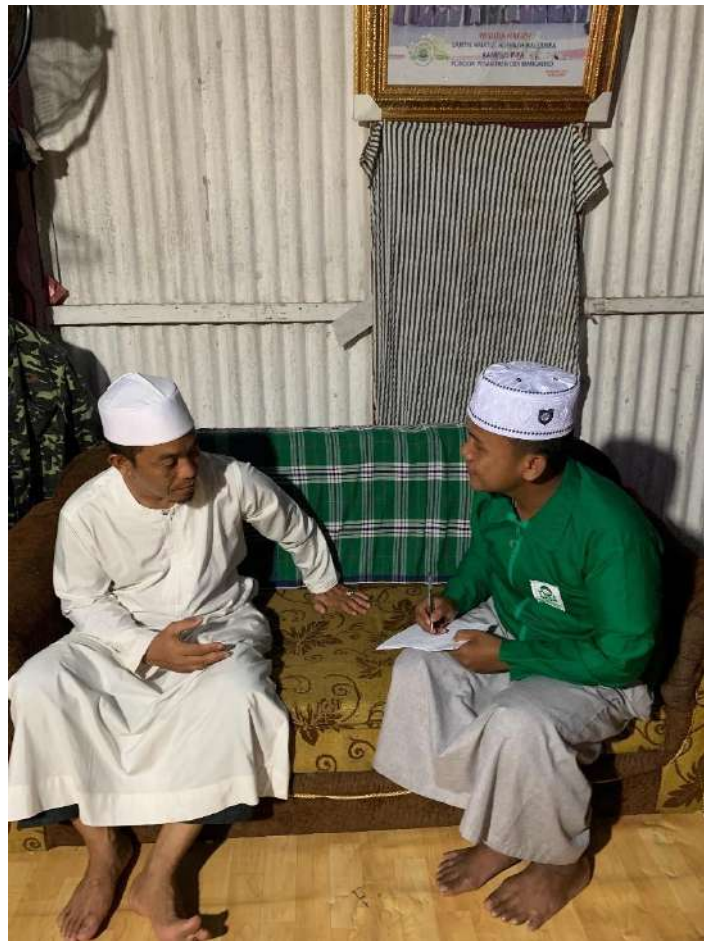
Wawancara dengan Pembina Asrama