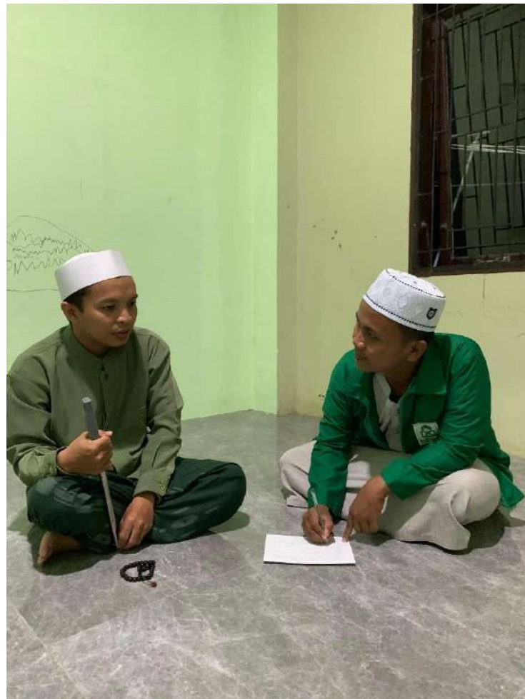
Wawancara dengan Pembina Asrama

UNIVERSITAS ISLAM NEGERI ALAUDDIN M A K A S S A R