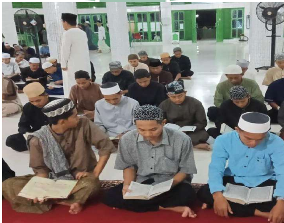
Dokumentasi kegiatan santri setoran hafalan