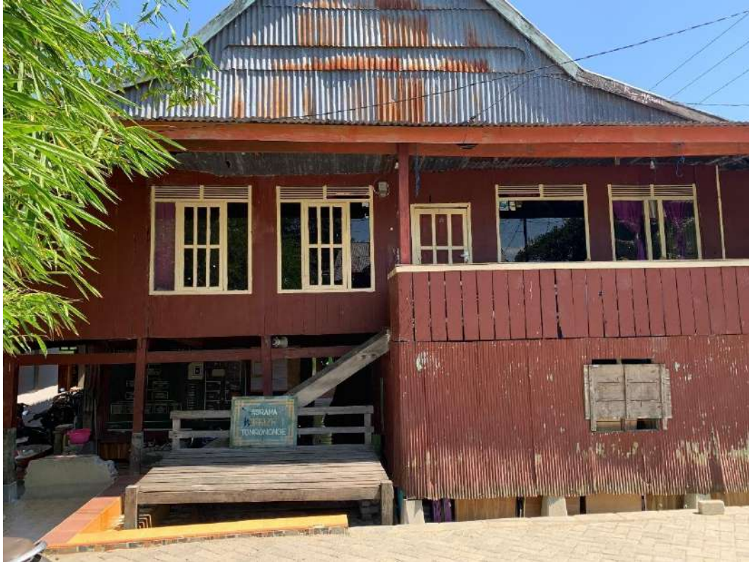
Lokasi Penelitian Asrama Huffadz 1

UNIVERSITAS ISLAM NEGERI ALAUDDIN M A K A S S A R