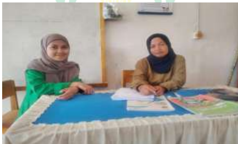
Wawancara dengan Wali Kelas II