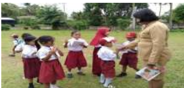
Gambar 4.7 Dokumentasi Kegiatan Pembelajaran di Luar Kelas

dengan arahan dari guru. Karena dengan terciptanya lingkungan belajar yang menyenangkan peserta didik tidak akan merasa bosan saat melakukan pembelajaran.