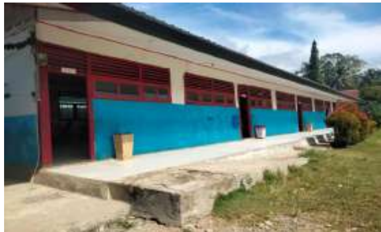
Ruang Guru Tampak Depan SD Negeri Talondo Kondo