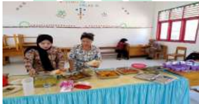
Gambar 4.3 Dokumentasi Kegiatan Makan Bersama Antara Guru-Guru dan Kepala Sekolah SD Negeri Talondo Kondo

Selain memberikan penghargaan kepada guru yang berprestasi dan juga memberikan kesempatan mengikuti pelatihan-pelatihan, strategi kepala sekolah yang ke-tiga yaitu menciptakan lingkungan kerja yang baik dan harmonis antara kepala sekolah dan guru. Dokumen terkait dengan strategi kepala sekolah dalam meningkatkan motivasi kerja guru yaitu dengan cara menciptakan lingkungan kerja yang baik dan harmonis antara kepala sekolah dan guru dapat dilihat pada gambar 4.3 dan 4.4.