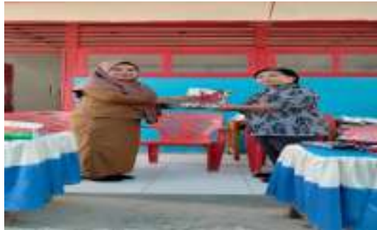
Gambar 4.1 Dokumentasi Pemberian Penghargaan Kepada Guru yang kreatif dan inovatif

Strategi yang ke-dua yaitu kepala sekolah juga memberikan kesempatan kepada guru untuk maju seperti memberikan kesempatan kepada guru untuk mengikuti diklat atau pelatihan-pelatihan. Dokumen terkait dengan diklat atau pelatihan-pelatihan tersebut dapat dilihat pada gambar 4.2.