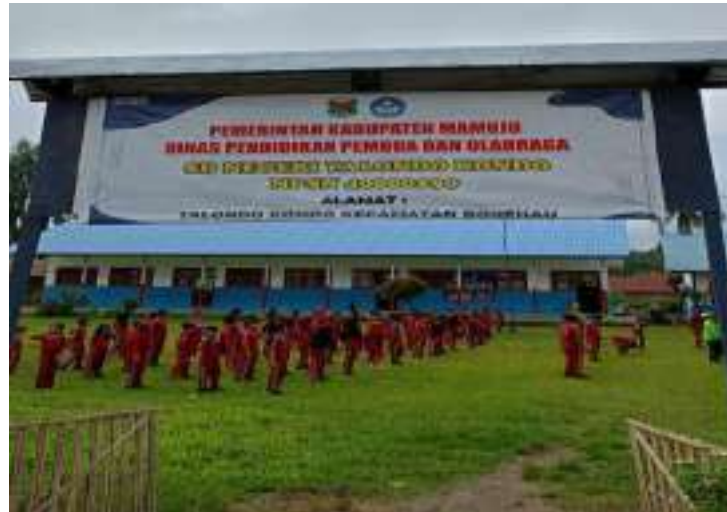
Pintu Gerbang SD Negeri Talondo Kondo