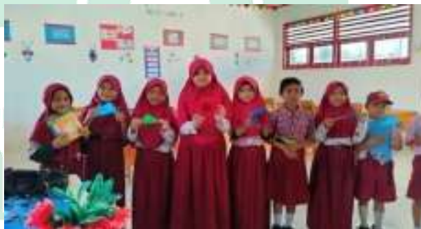
Gambar 4.6 Dokumen Kegiatan Siswa/Siswi Membuat Bunga Untuk Dipajang di Kelas SD Negeri Talondo Kondo

Dari beberapa pernyataan di atas dapat diketahui bahwa motivasi yang dimiliki oleh guru-guru di SD Negeri Talondo Kondo adalah sama-sama ingin mencapai tujuan pendidikan yaitu terciptanya sumber daya manusia yang berkualitas dan juga pemimpin yang berkualitas di masa yang akan datang. Sehingga motivasi kerja yang guru-guru miliki yaitu ingin menciptakan lingkungan belajar yang nyaman dan menyenangkan. Dokumen yang terkait dengan motivasi guru yang ingin menciptakan lingkungan belajar yang nyaman dan menyenangkan dapat dilihat pada gambar 4.6 dan 4.7 di bawah.