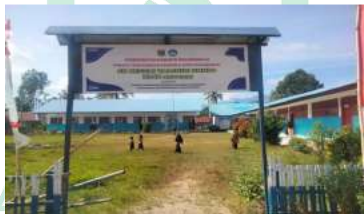
Profil Sekolah SD Negeri Talondo Kondo