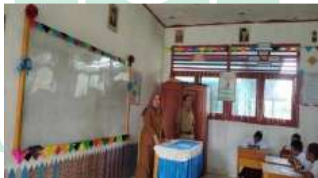
Gambar 4.5 Dokumentasi Kegiatan Arahan Kepala Sekolah Kepada Guru SD Negeri Talondo Kondo

Selain memberikan reward atau penghargaan, memelihara lingkungan serta hubungan kerja yang baik dan harmonis kepala sekolah juga memberikan arahan serta bimbingan apabila guru saat melaksanakan tugasnya mengalami kendala terutama cara mengajar, agar lebih ditingkatkan lagi kekreatifannya agar peserta didik tidak merasa bosan. Dokumen terkait dengan pemberian arahan kepala sekolah terhadap guru yang mengalami kendala dalam mengajar dapat dilihat pada gambar 4.5.