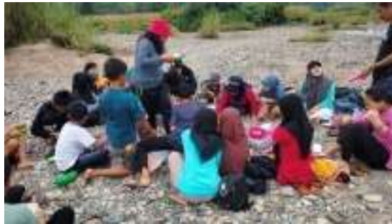
Gambar 4.4 Dokumentasi Kegiatan Makan Bersama Kepala Sekolah, Guru dan Peserta Didik.

Selain memberikan reward atau penghargaan, memelihara lingkungan serta hubungan kerja yang baik dan harmonis kepala sekolah juga memberikan arahan serta bimbingan apabila guru saat melaksanakan tugasnya mengalami kendala terutama cara mengajar, agar lebih ditingkatkan lagi kekreatifannya agar peserta didik tidak merasa bosan. Dokumen terkait dengan pemberian arahan kepala sekolah terhadap guru yang mengalami kendala dalam mengajar dapat dilihat pada gambar 4.5.