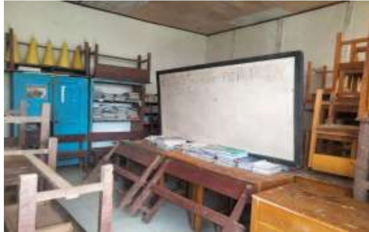
Srtuktur Organisasi SD Negeri Talondo Kondo