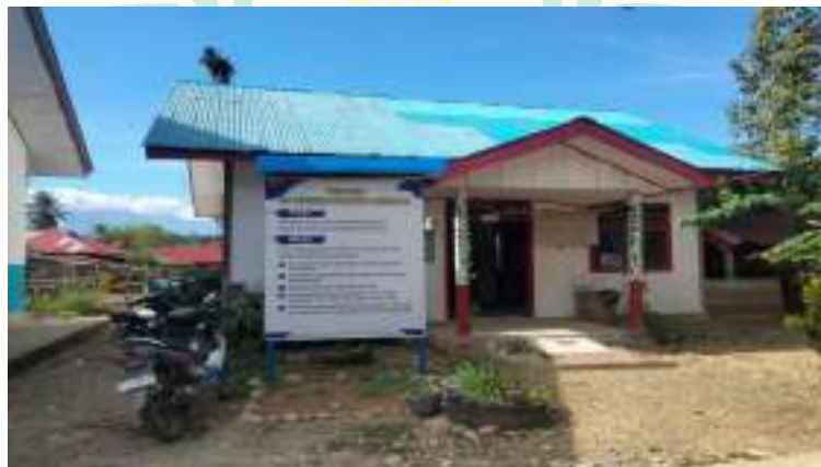
Ruang Guru SD Negeri Talondo Kondo