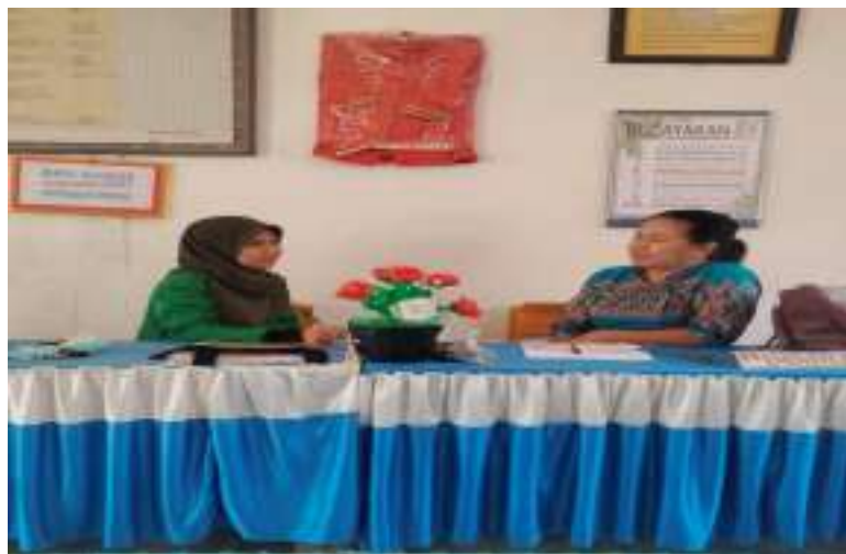
Wawancara dengan Wali Kelas V