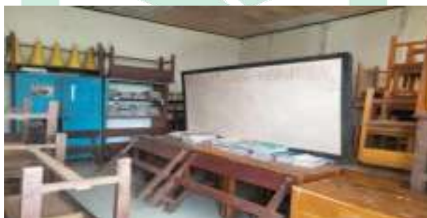
Gambar 4.8 Dokumentasi Ruang Perpustakaan SD Negeri Talondo Kondo

Dari pernyataan kepala sekolah di atas maka dapat diketahui bahwa kendala yang dihadapi kepala sekolah dalam meningkatkan motivasi kerja guru di SD Negeri Talondo Kondo adalah faktor sifat dan perilaku guru yang berbeda-beda. Sesuai dengan mengamatan awal peneliti di mana ada beberapa guru yang kurang disiplin atau tidak mematuhi peraturan tata tertib sekolah yaitu datang tidak tepat pada waktunya. Selanjutnya, faktor sarana dan prasarana yang kurang mendukung, dapat dilihat pada gambar 4.8.