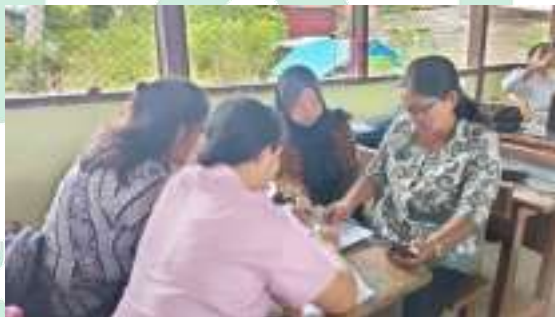
Gambar 4.2 Dokumentasi Pelaksanaan Kegiatan Diklat IKM

Strategi yang ke-dua yaitu kepala sekolah juga memberikan kesempatan kepada guru untuk maju seperti memberikan kesempatan kepada guru untuk mengikuti diklat atau pelatihan-pelatihan. Dokumen terkait dengan diklat atau pelatihan-pelatihan tersebut dapat dilihat pada gambar 4.2.