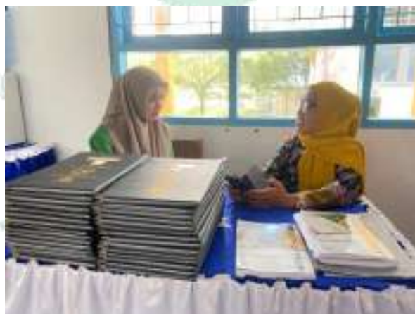
Wawancara dengan salah satu guru Jurusan Tata Busana SMKN 2 Soppeng