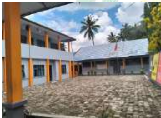
Lapangan SMKN 2 Soppeng