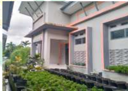
Lab. Jurusan Pertanian