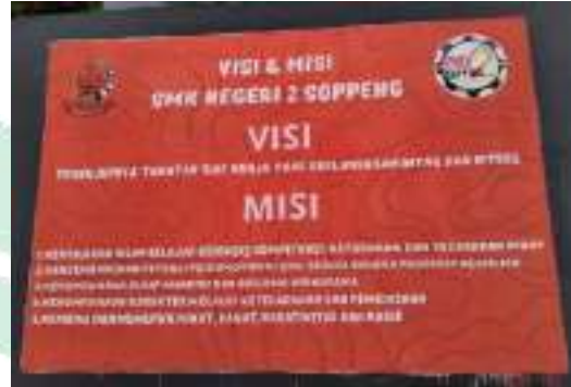
Visi Misi SMKN 2 Soppeng