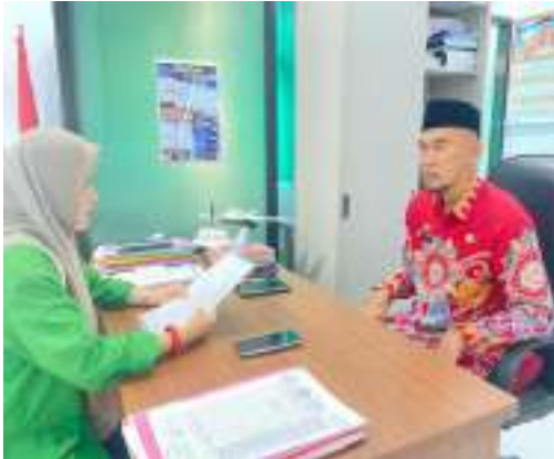
Wawancara dengan Kepala Sekolah SMKN 2 Soppeng