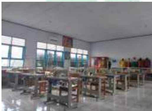
Lab. Jurusan Tata Busana