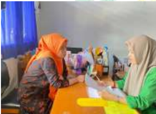
Wawancara dengan salah satu guru Jurusan Pertanian SMKN 2 Soppeng