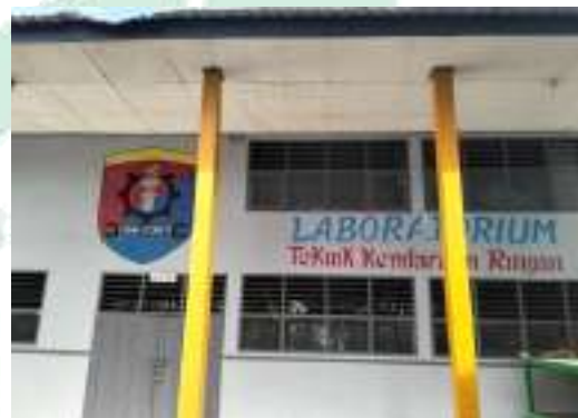
Lab. Jurusan Otomotif