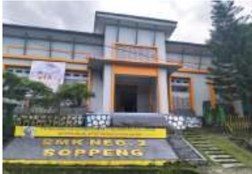
Gerbang SMKN 2 Soppeng