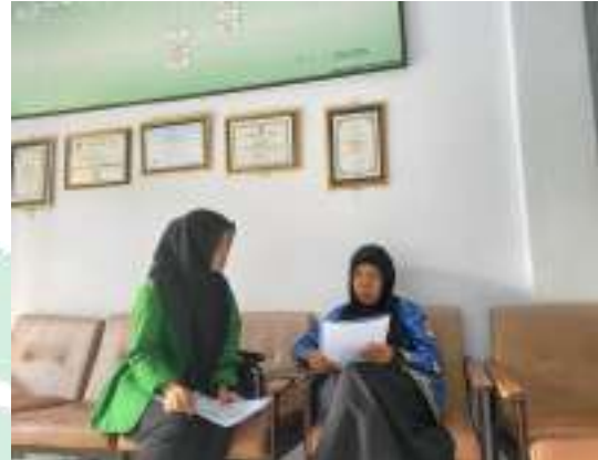
Wawancara dengan Waka Humas dan Hubin SMKN2 Soppeng