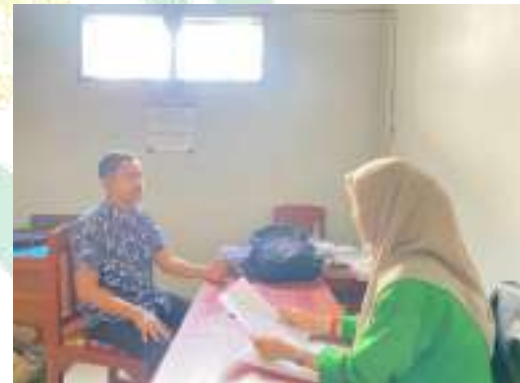
Wawancara dengan salah satu guru Jurusan Otomotif SMKN 2 Soppeng