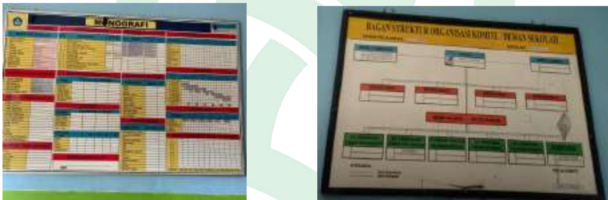
Gambar 4: Monografi dan Struktur Organisasi Komite Sekolah UPT SDN 192 Pinrang