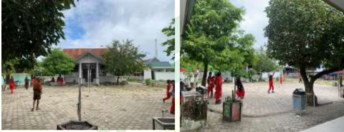
Gambar 3: Tampak Halaman UPT SDN 192 Pinrang