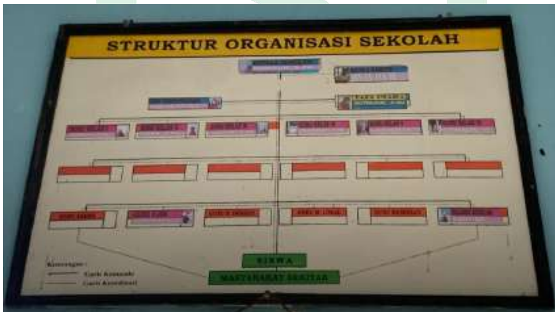
Gambar 6: Struktur Organisasi Sekolah UPT SDN 192 Pinrang