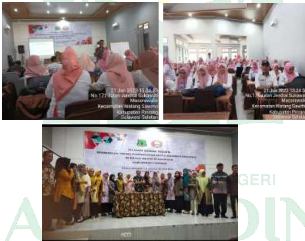
Gambar 4.2 Proses Pelaksanaan Pelatihan Peningkatan Mutu Assesmen Nasional Oleh Dikbud Kabupaten Pinrang Tahun 2023