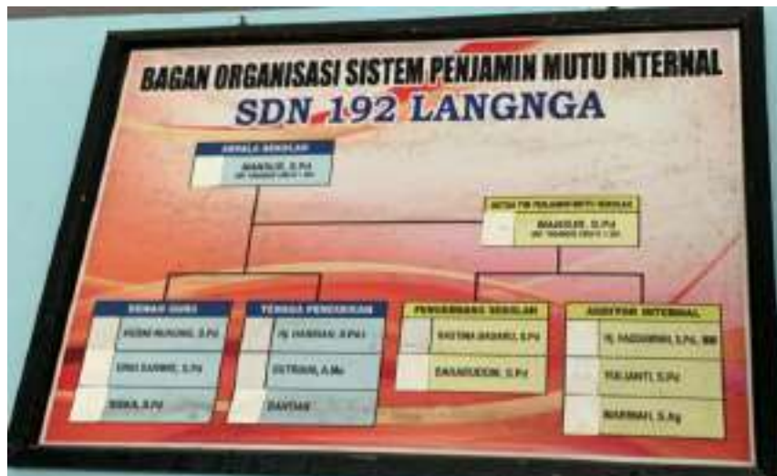
Gambar 7: Bagan Organisasi Sistem Penjaminan Mutu Internal UPT SDN 192 Pinrang