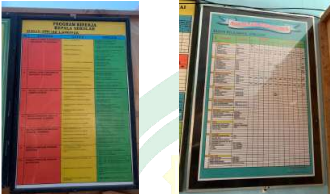
Gambar 5: Program Kinerja Kepala Sekolah dan Program kerja Jangka Menengah Kepala Sekolah UPT SDN 192 Pinrang