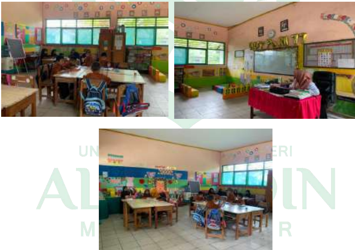
Gambar 8: Ruang Kelas UPT SDN 192 Pinrang