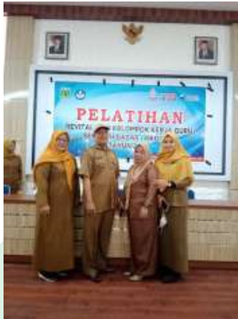
Gambar 4.1 Proses Pelaksanaan Pelatihan KKG Oleh Dikbud Kabupaten Pinrang Tahun 2023