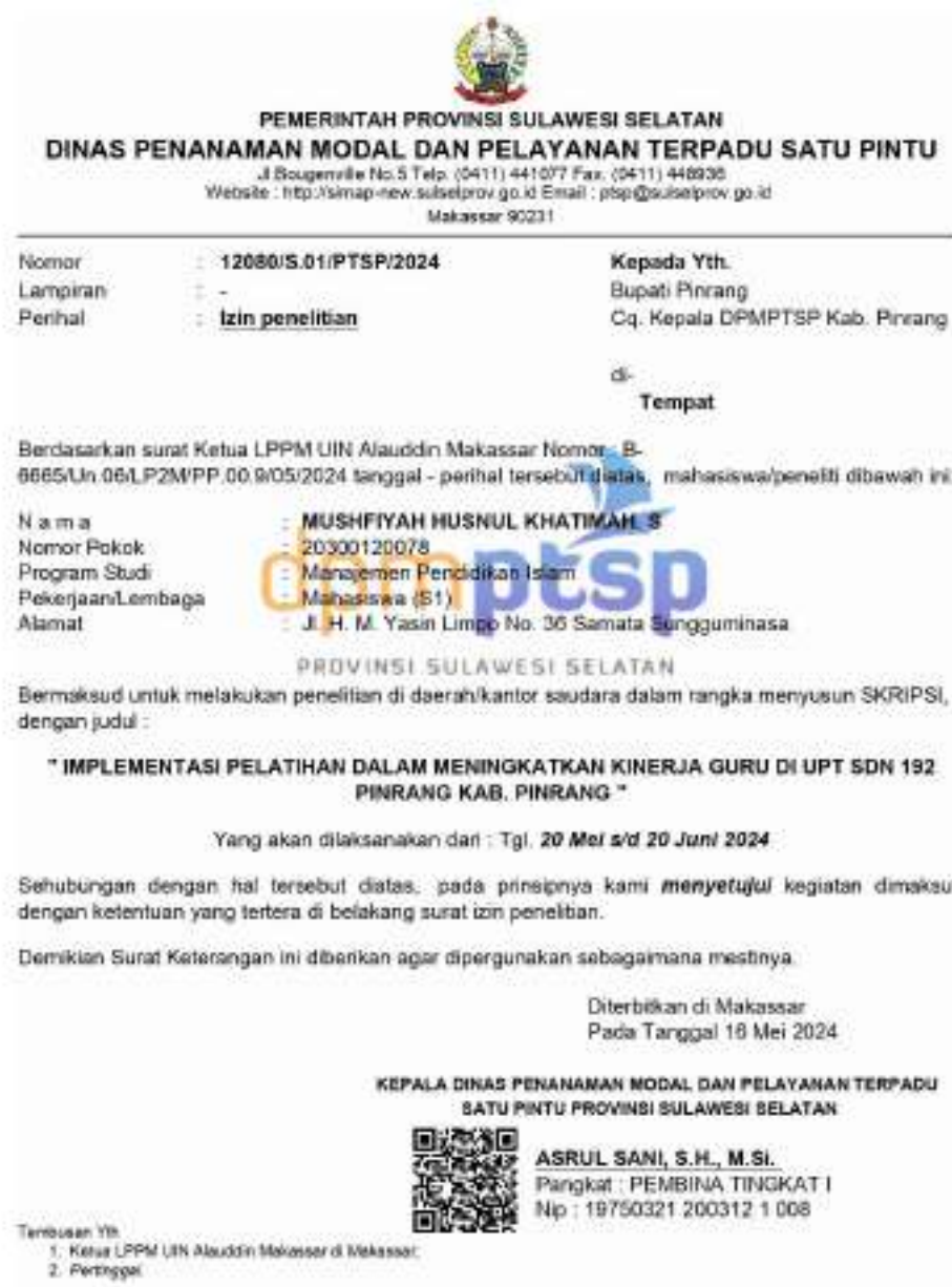
Gambar 1: Persuratan dari PTSP Provinsi