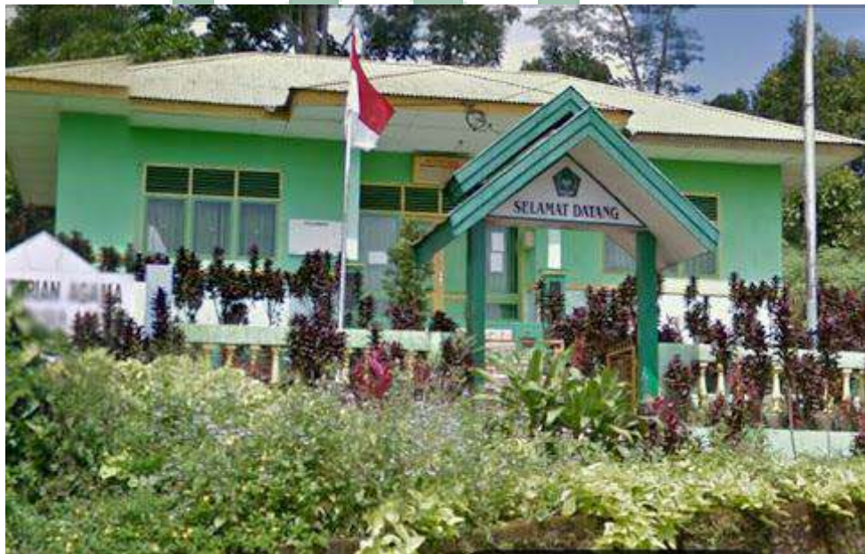
Gambar 1: Kantor Urusan Agama (KUA) Kecamatan Sinjai Borong, Kabupaten Sinjai, 21 Juni 2024.