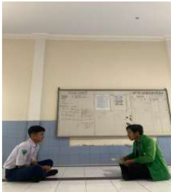
peneliti melakukan wawancara dan penandatanganan persetujuan menjadi responden dengan salah satu peserta di masjid SMPN 1 Tinggimoncong