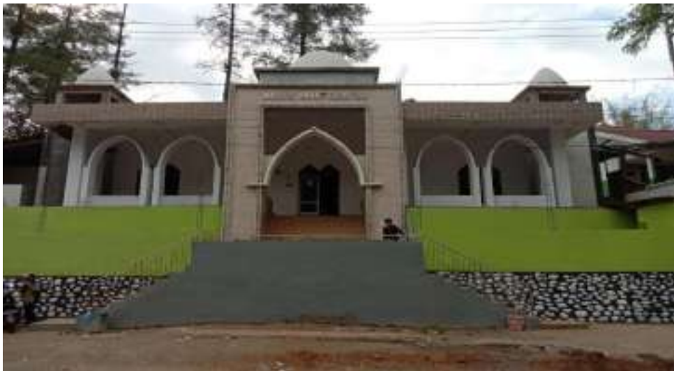
Mesjid SMPN 1 Tinggimoncong