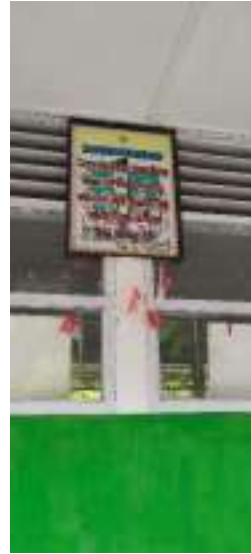
Gambar poster yang berisikan kata bijak