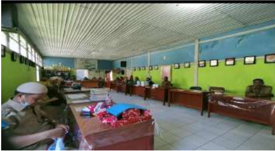
Ruang Guru SMPN 1 Tinggimoncong