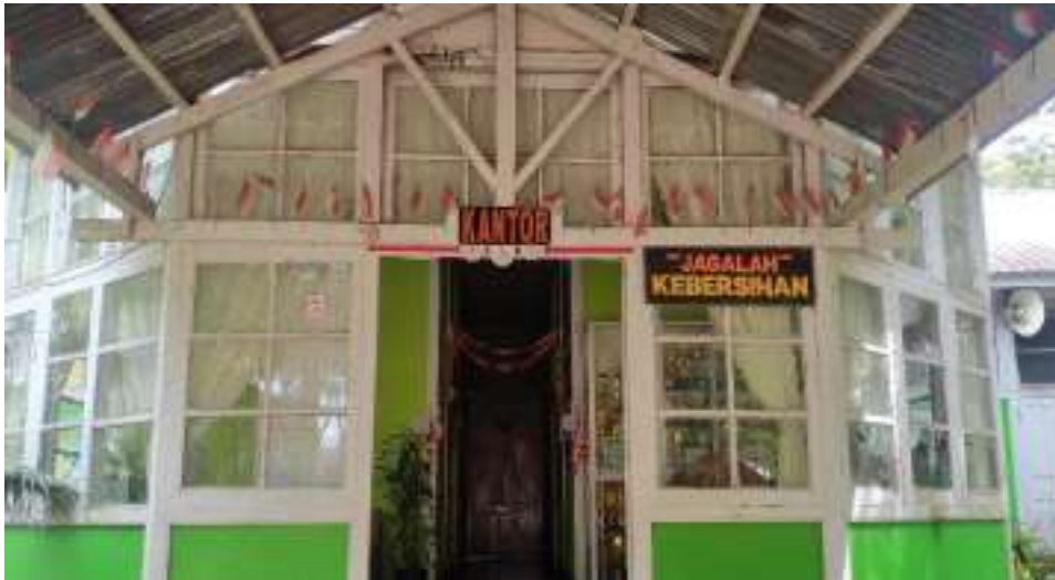
Kantor SMPN 1Tinggimoncong