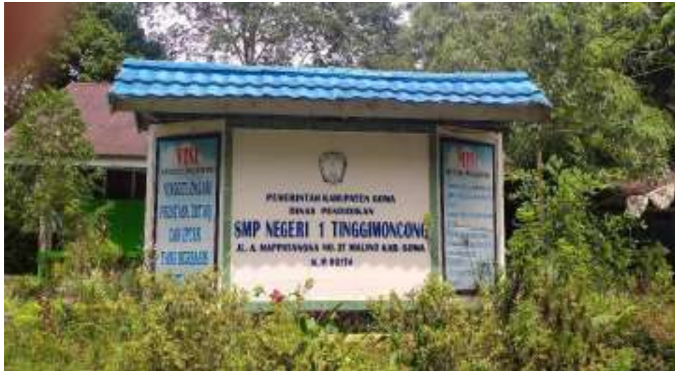
Papan nama dan visi misi SMPN 1 Tinggimoncong