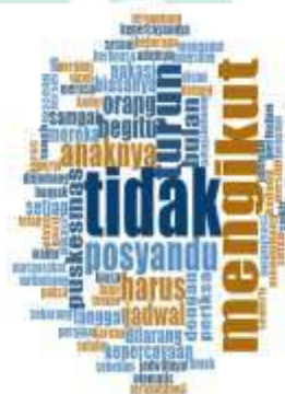
Variabel Sarana Prasarana