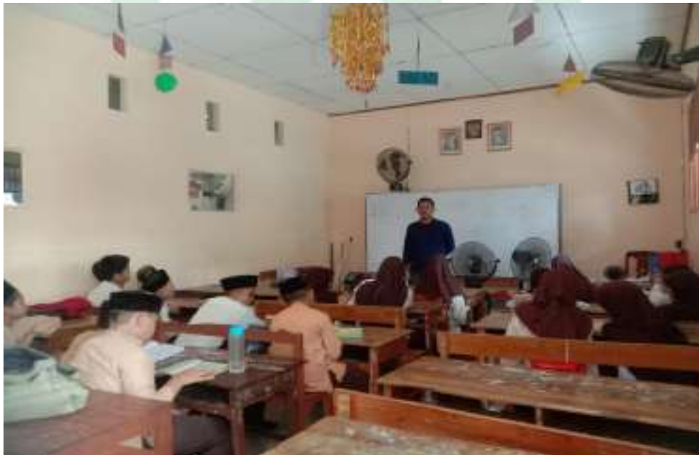
kegiatan mengajar BTQ