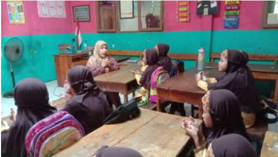
Berdoa Sebelum belajar