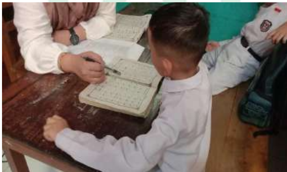
Mengajar dengan menggunakan Metode Iqra