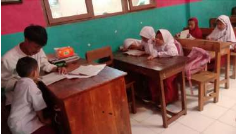
kegiatan mengajar baca al-Qur'an