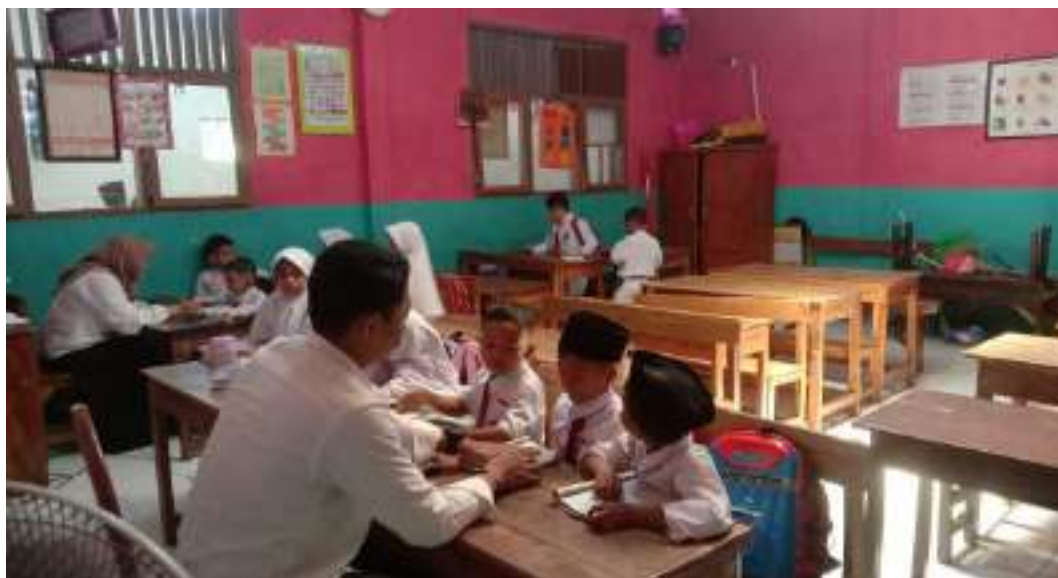
Kegiatan Mengajar membaca Al-Qur'an