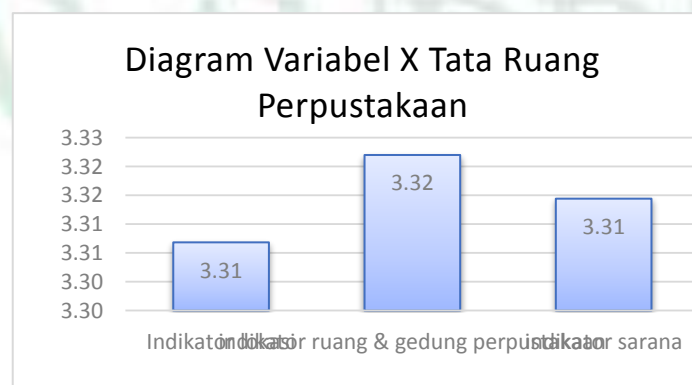
Diagram 4.1 (variabel x)

Berdasarkan nilai rata-rata dari tiap indikator diatas maka dapatdibuatkan diagram sebagai berikut: