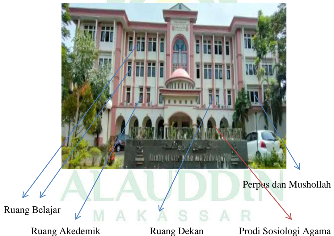
Gambar 4.1 Lokasi Penelitian Fakultas Ushuluddin dan Filsafat

Penelitian ini berlokasi di Fakultas Ushuluddin dan Filsafat Kampus II UIN Alauddin Makassar Jalan H.M. Yasin Limpo No. 36 Samata Gowa Sulawesi Selatan. Perjalanan dari karebosi Makassar ke kampus II Uin Alauddin Makassar sejauh 10 km dengan menggunakan kendaraan umum seperti Grab, pete-pete, teman bus, maupun kendaraan pribadi.