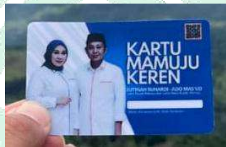
Gambar 2.1 Kartu Mamuju Keren

Berhubungan dengan tujuan utama diadakannya program Kartu Mamuju Keren yaitu untuk meningkatkan kesejahteraan masyarakat maka penerima manfaat Kartu Mamuju Keren adalah masyarakat yang kategori pra sejahtera atau non-ASN.