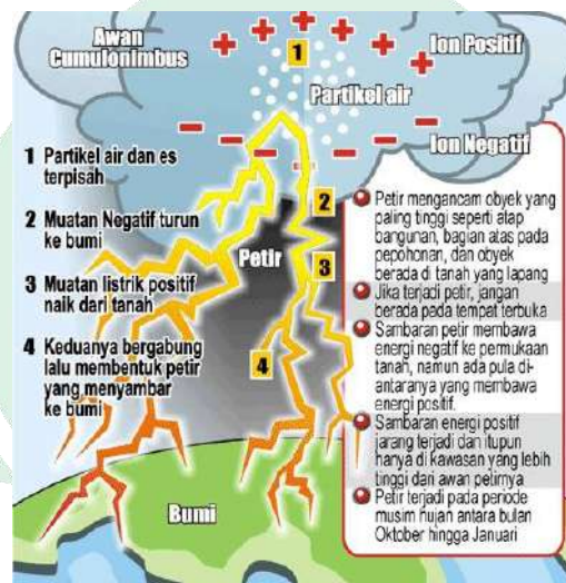
Gambar 4.4 Ilustrasi Terjadinya Halilintar/Petir

Ilustrasi Terjadinya Halilintar/Petir 54