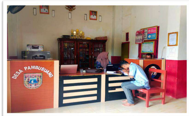
Gambar 01: Photo di atas, memperlihatkan proses penyerahan Surat Pengantar Izin Penelitian di Kantor Desa Pambusuang.