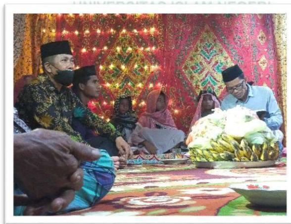
Gambar Masyarakat melakukan tradisi maqbaça Barazanji diacara pernikahan dan mappatammaq qoroang

sebab pelaksanaan maqbaça barazanji selalu saja melibatkan banyak orang sehingga besar kemungkinan dapat meningkatkan komunikasi antar masyarakat. Ketiga meningkatkan pola ibadah kita kepada Allah swt. sebab yang membaca barazanji secara tidak langsung mengarahkan kita untuk menjalankan salah satu rukun iman yaitu iman kepada Rasul dan Nabi Allah swt. 113 Pembacaan kitab Barazanji ini selalu disisipkan dalam berbagai acara, seperti acara keselamatan, pernikahan, aqiqah dan lain sebagainya. Hal ini dilakukan karena masyarakat Mandar menyakini bahwa pembacaan kitab Barazanji berarti kita banyak menyebut nama Nabi Muhammad saw. dan orang yang banyak menyebut nama beliau dapat menjadi benteng dari segala macam barabahaya dan ini berdasarkan QS al-Anfāl/8: 33 dan kepercayaan itulah menjadi warisan yang sampai saat ini maqbaça barazanji selalu dilaksanakan walaupun ahli hajat tidak mengerti tentang dalil-dalil, tidak tahu baca Al-Qur'an dan bahkan tidak paham aḥkām al-ḥurūf . sebab hal itu (pembacaan barazanji) sudah menjadi nilai tersendiri bagi kalangan masyarakat Mandar khususnya di Desa Pambusuang.