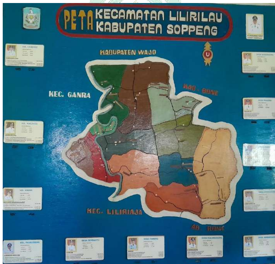
Gambar 4.1 Gambar Peta Kecamatan Lilirilau Kabupaten Soppeng.