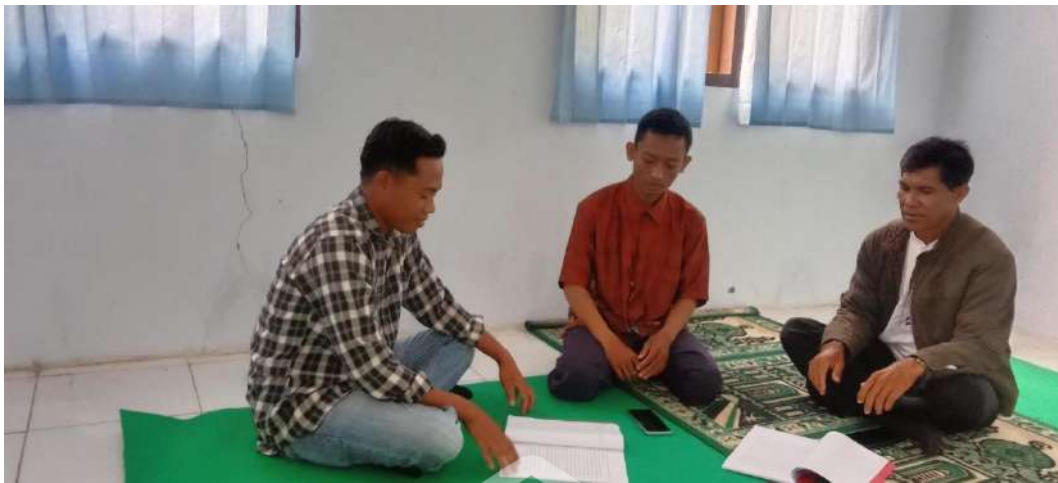
Wawancara Dengan Penyuluh Agama Kecamatan Donggo