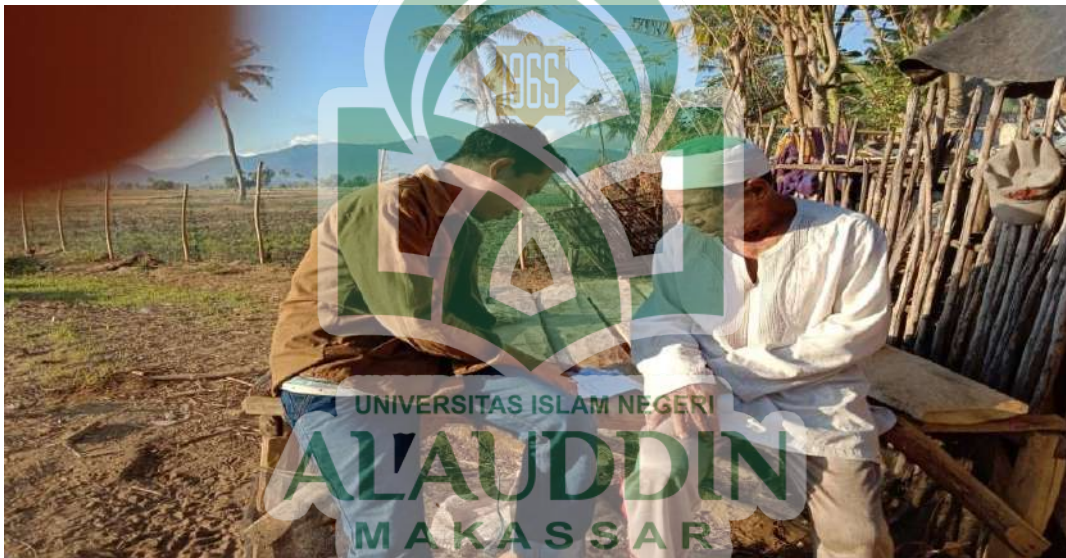
Wawancara Tokoh Adat