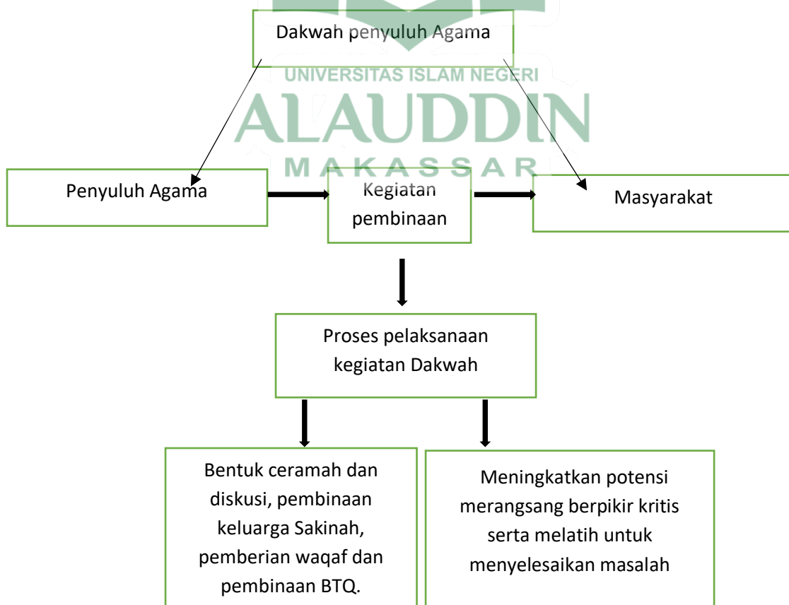
Kerangka pikir gambar 1.1

Ketiga , pengumpulan data melalui wawancara, observasi, dan dokumentasi melalui informan penelitian atau responden penelitian. Dalam mengumpulkan data penelitian tentang dakwah penyuluh Agama pada masyarakat penganut kepercayaan makakamba makakimbi . Keempat , mengambil kesimpulan dan verifikasi. Langkah yang terakhir adalah menyimpulkan dari verifikasi (dibuktikan), dengan data-data baru yang memungkinkan diperoleh keabsahan hasil penelitian. Sejak awal peneliti harus mencari makna data yang dikumpulkanya. Dari data yang diperoleh peneliti mencoba mengambil kesimpulan yang masih sangat tentatif, kabur, diragukan, tetapi dengan bertambahnya data maka kesimpulan itu lebih grounded . Jadi kesimpulan senantiasa harus diverifikasi selama penelitian berlangsung.