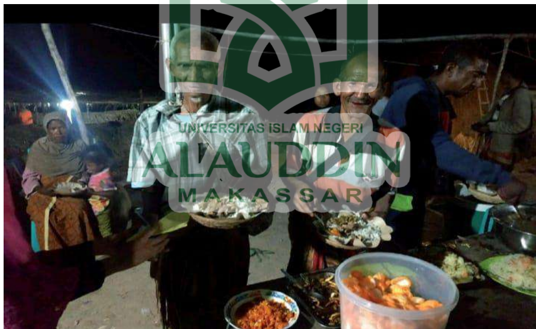
Foto makan Bersama panggawa