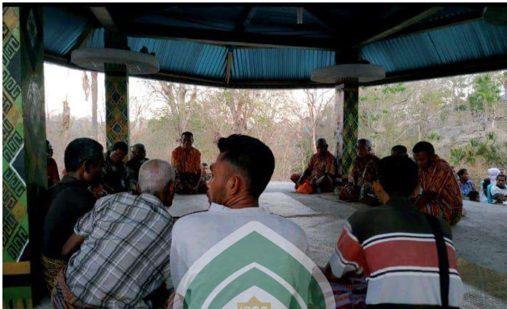
Foto sebelum tradisi makakamba makakimbi dilakukan