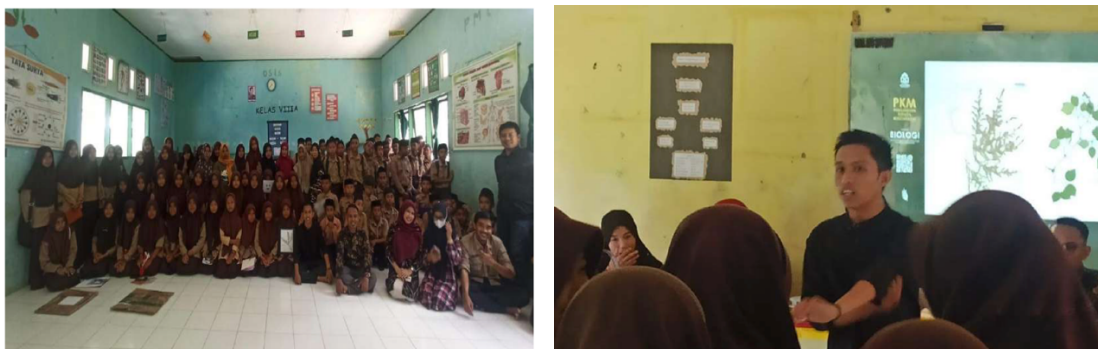
Gambar 1. Antusiasme siswa dan guru MTs. Darul Muttaqin Componge

Salah satu keberhasilan utama dari program ini adalah meningkatnya keterlibatan siswa dalam setiap tahapan kegiatan. Siswa secara aktif mengikuti eksplorasi lapangan, mengumpulkan spesimen tanaman obat, serta berpartisipasi dalam pembuatan dan dokumentasi herbarium. Keterlibatan ini mendorong rasa ingin tahu mereka terhadap keanekaragaman hayati serta meningkatkan kepedulian terhadap lingkungan sekitar. Berdasarkan studi yang dilakukan oleh Smith et al. (2020), metode pembelajaran berbasis proyek seperti herbarium dapat meningkatkan motivasi belajar siswa dan keterlibatan aktif mereka hingga 70% lebih tinggi dibandingkan dengan metode ceramah. Dalam konteks ini, siswa tidak hanya menjadi penerima informasi secara pasif, tetapi juga turut serta dalam proses penggalian pengetahuan melalui aktivitas berbasis eksplorasi dan praktik langsung.