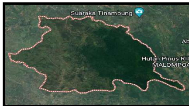
Gambar 3.1 Peta Desa Barugaya