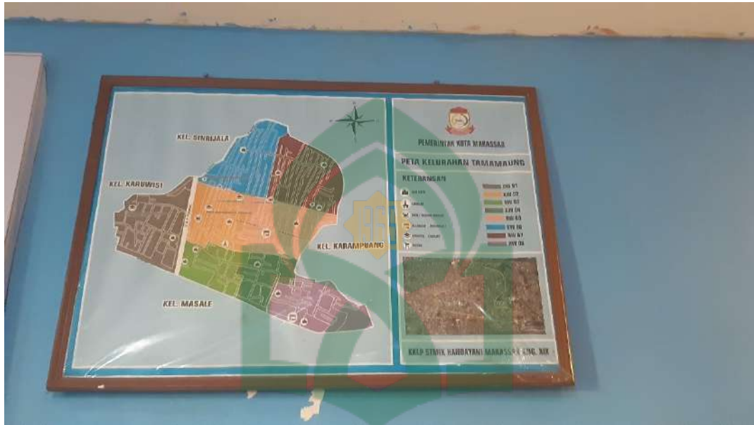
Gambar 1. Peta Kelurahan Tamamaung