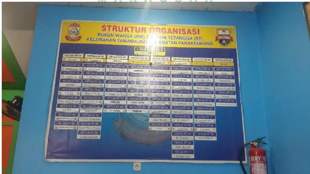
Gambar 1. Daftar RT dan RW Kelurahan Tamamaung