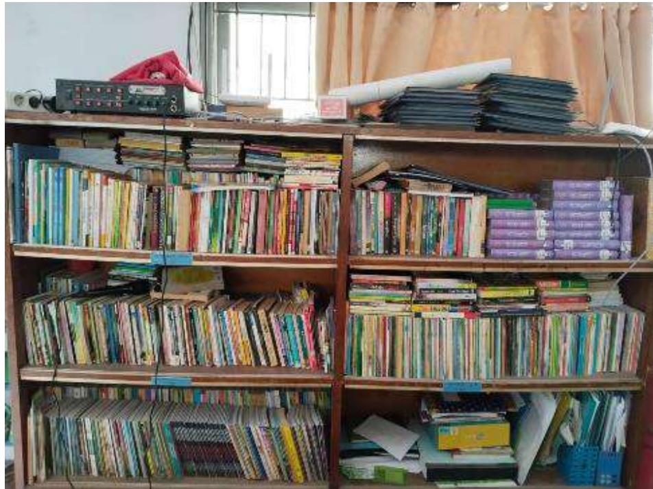
Gambar 4.4 Lemari Koleksi Referensi

Sumber data: Perpustakaan SMA Negeri 14 Gowa 2024