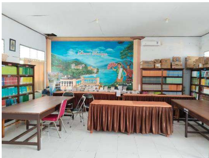
Gambar 4.2 Ruang Baca

Sumber Data: Perpustakaan SMA Negeri 14 Gowa 2024