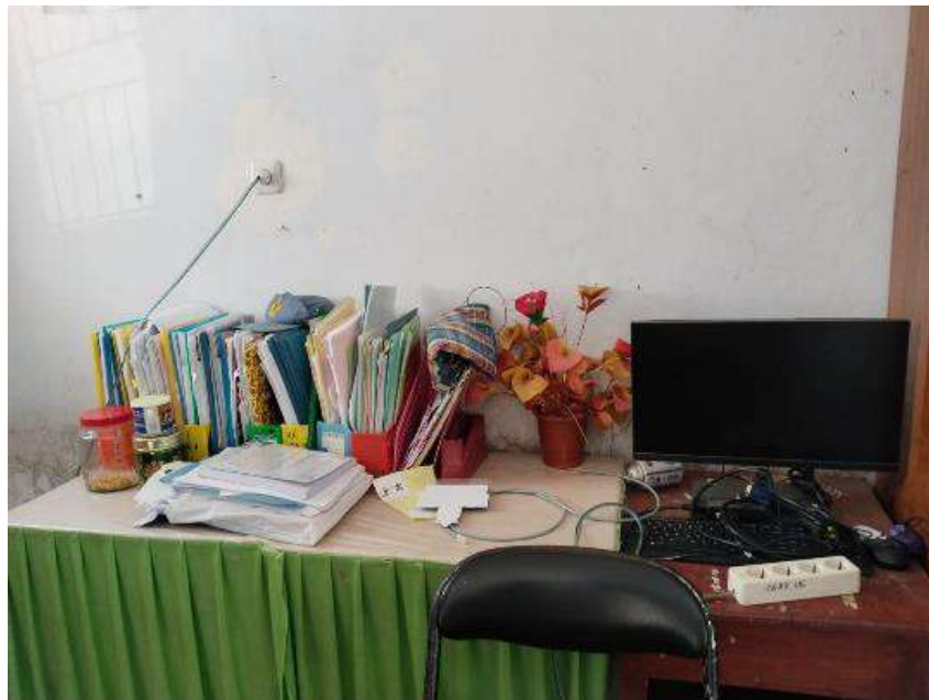
Gambar 4.1 Komputer yang rusak