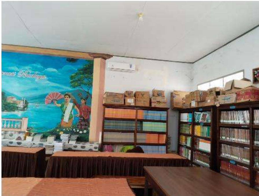
Gambar 4.3 Rak Buku Koleksi Umum