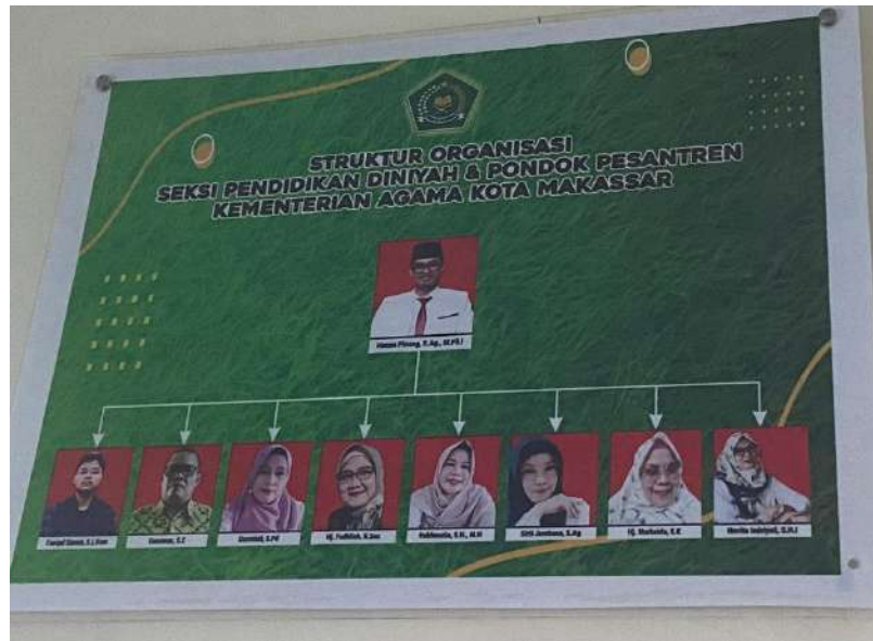
Gambar 1 struktur organisasi

Tugas: Melakukan pelayanan, bimbingan teknis di bidang pendidikan madrasah diniyah takmiliah, pendidikan diniyah, pendidikan al-Quran, dan pondok pesantren, serta pengelolaan data dan informasi pendidikan diniyah dan pondok pesantren.