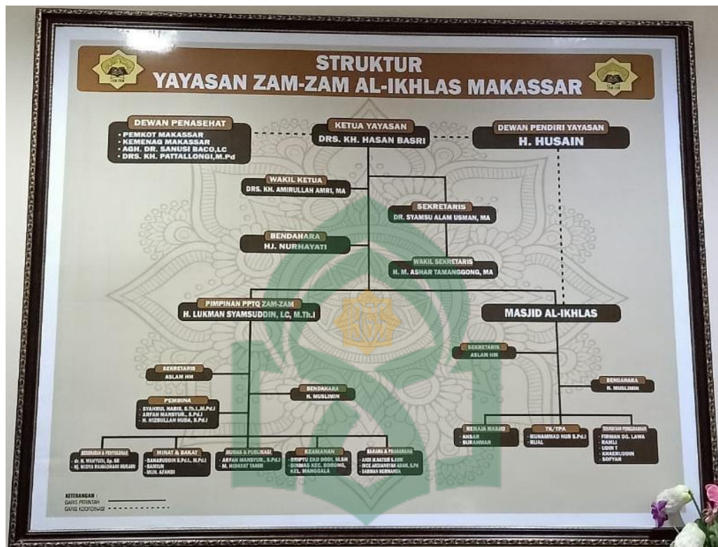
Gambar 1. Struktur Yayasan Zam-Zam Al Ikhlas Makassar