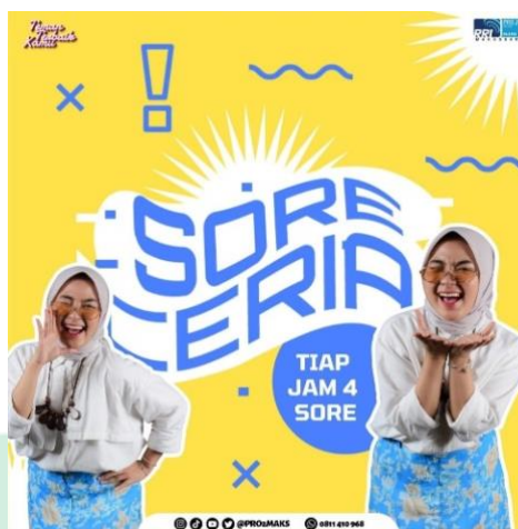
Gambar 4.3 Program 'Sore Ceria'

"Program 2 memiliki segmen yang lebih ditujukan kepada kalangan anak muda. Sebelum ada perubahan dalam pola acara siaran, Program 'Sore Ceria' lebih fokus pada profil individu yang berprestasi atau memiliki bakat dari berbagai latar belakang. Namun, setelah ada perubahan dalam pola siaran, Program 'Sore Ceria', yang sebelumnya dikenal sebagai 'Numpang-Numpang', tetap memiliki fokus yang sama yaitu menghadirkan narasumber yang memiliki bakat atau prestasi dan tetap membahas topik yang relevan dengan anak muda, sehingga konten yang di hasilkan dapat di minati". 8