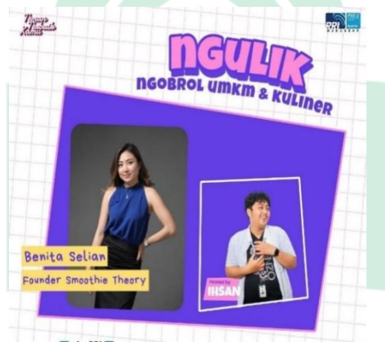
Gambar 4.4 Program Ngulik

“Program ‘Sore Ceria’ berlangsung dari pukul 16.00 hingga 20.00 malam, dengan sejumlah segmen dan konten yang ditampilkan di dalamnya, seperti ngobrol tentang UMKM dan berbagai jenis acara lainnya. Pada pukul 16.00, kami membahas hal-hal seperti profil penyanyi atau topik yang dapat memberikan inspirasi kepada generasi muda saat ini. Kami mengundang narasumber yang memiliki pengalaman yang berharga dan dapat membagikannya kepada audiens , terutama generasi muda. Strategi ini merupakan bagian dari upaya kami untuk mempertahankan dan menarik perhatian pendengar, terutama generasi muda”. 9