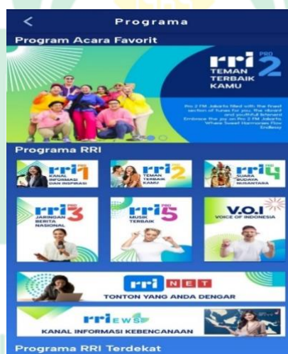
Gambar 3.1 Aplikasi RRI Digital

Sejalan dengan hal itu, perkembangan teknologi di masa sekarang semakin canggih dengan berbagai platform yang telah disediakan. Jaringan internet telah menjadi pelopor terjadinya revolusi teknologi. Internet semakin di minati oleh banyak kalangan baik perorangan maupun lembaga pemerintah ataupun swasta. Informasi yang di publikasikan dalam internet, dengan segera tersedia keseluruh pengguna audiens secara global. 29 RRI Makassar saat ini telah mengalami perkembangan yang signifikan, memungkinkan pendengar untuk menikmati siaran secara online melalui aplikasi rri Digital .