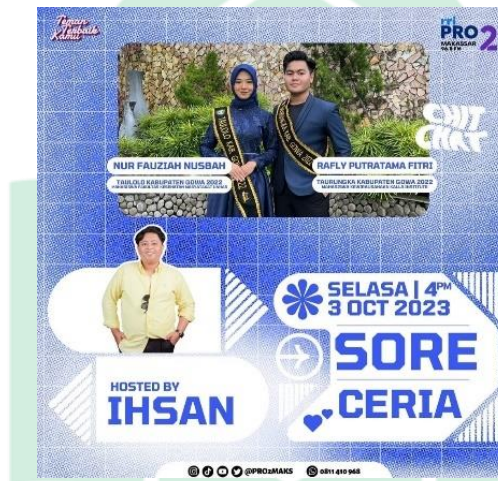
Gambar 4.5 'Sore Ceria'

Keberhasilan suatu acara ditentukan oleh kualitas dari orang yang terlibat di dalamnya. Program 'Sore Ceria' sebagai program yang berformat dialog tentunya selain penyiar, narasumber juga berperan dalam menentukan keberhasilan Program 'Sore Ceria' maka dari itu, menghadirkan narasumber yang berprestasi di bidangnya sangat dibutuhkan agar dapat menginspirasi dan juga meyakinkan kawula muda baik dalam bidang pendidikan maupun keagamaan.