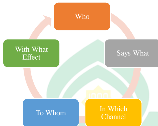
Tabel 3.1 Skema Komunikasi Model Laswell

langsung maupun tidak langsung dengan maksud agar memberikan dampak yang diharapkan oleh komunikator. Berikut adalah kelima unsur “ who, says what, in which channel, to whom and with what effect? ”.