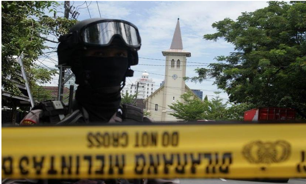
Gambar 4.4 Gambar dalam Berita Media Kompas.com