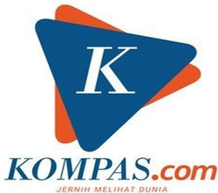
Gambar 4.2 Logo Media Daring Kompas.Com