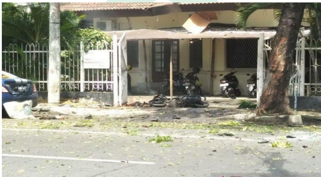
Gambar 4.3 Gambar dalam Berita Media Antaranews.com