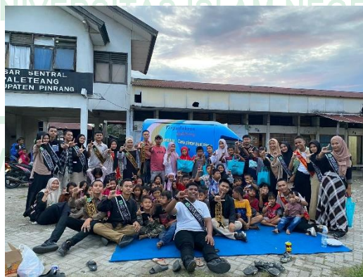
Gambar 4.2 Perpustakaan Keliling