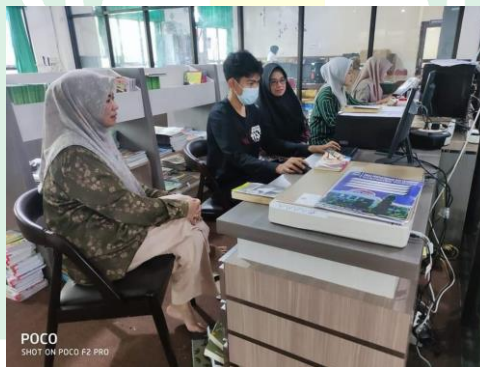
Gambar 4.1 Pojok Baca Digital

Pojok baca digital (PoCaDi) adalah tempat membaca yang menyediakan koleksi buku cetak dan buku digital (e-book). POCADI dilengkapi dengan perangkat dan aplikasi untuk media promosi, kegiatan, serta koleksi e-book, audio, dan video yang direkomendasikan pada banner yang tersedia. Tujuan POCADI adalah memudahkan akses informasi dan meningkatkan indeks literasi masyarakat. Berikut beberapa manfaat POCADI pada Perpustakaan yaitu: