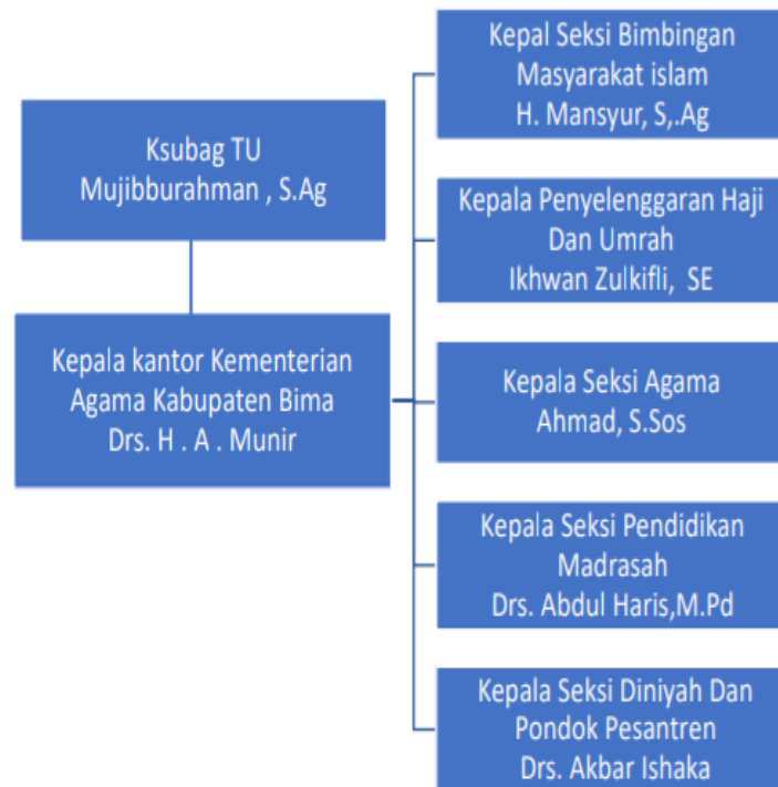
Gambar 4. 1 :

Struktur organisasi ini merupakan struktur sebelum kepala Kementerian Agama Drs. H. A Munir pensiun pada 31 Desember 2023. 4