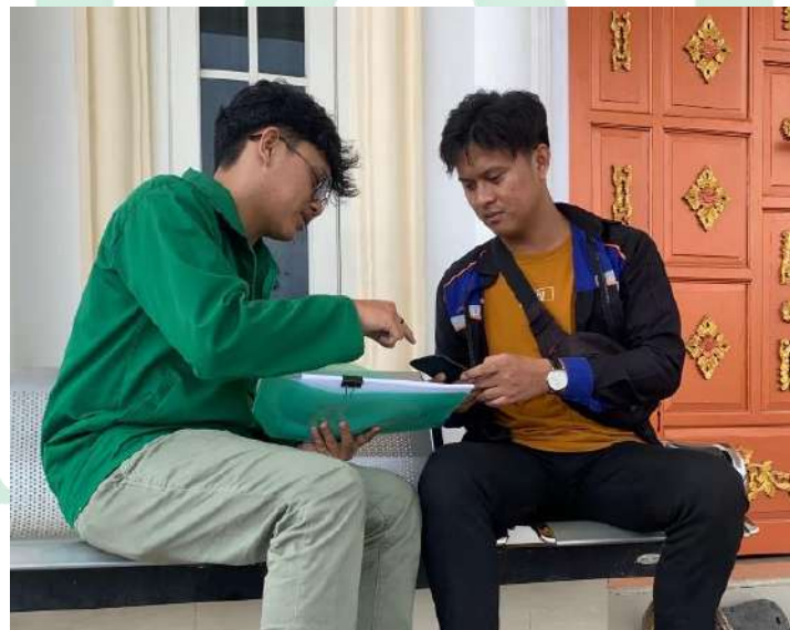
Gambar 1.2 Pengisian Kuesioner oleh Responden