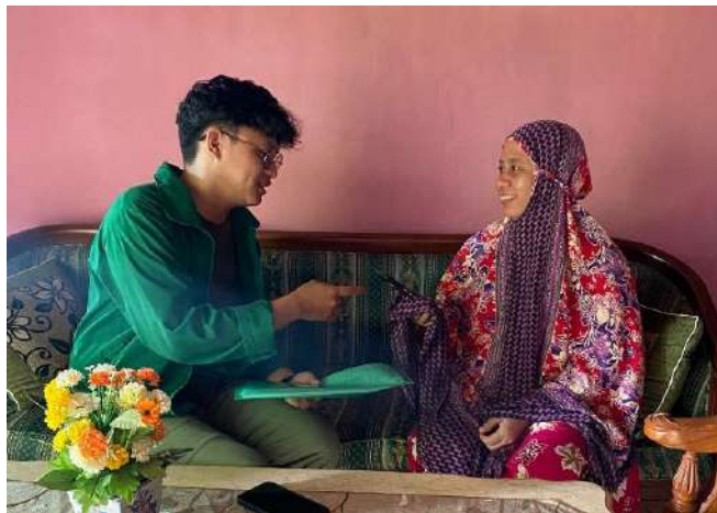
Gambar 1.3 Pengisian Kuesioner oleh Responden