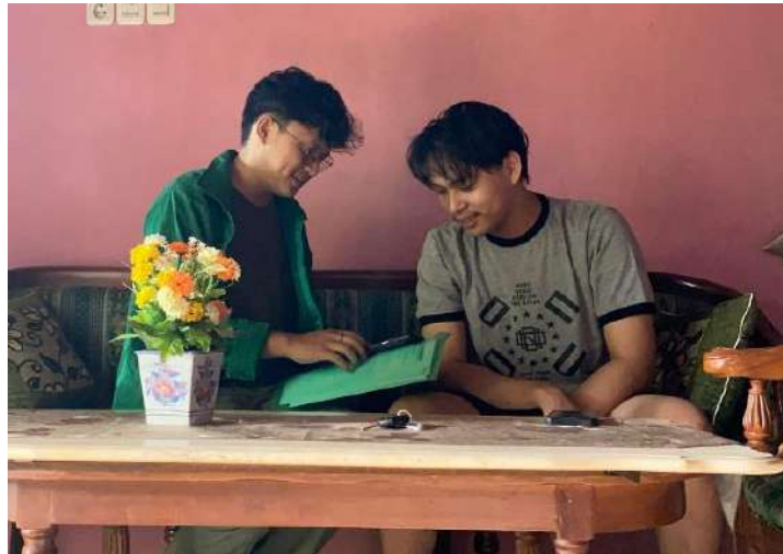
Gambar 1.1 Pengisian Kuesioner oleh Responden