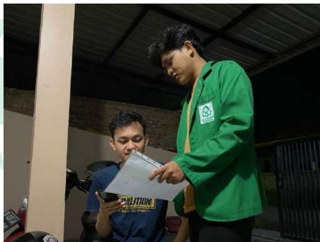
Gambar 1.5 Pengisian Kuesioner oleh Responden