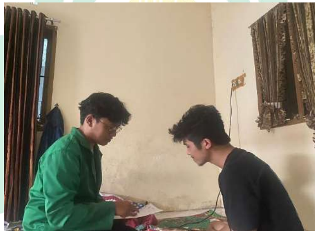
Gambar 1.4 Pengisian Kuesioner oleh Responden